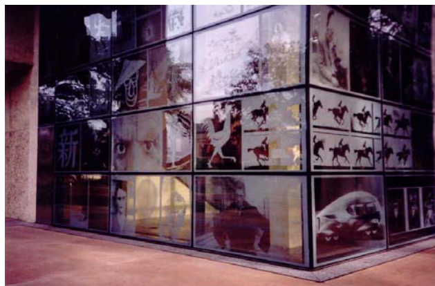
Façade du HRHRC

So long as we live, they too shall live, for they are now a part of us as we remember them