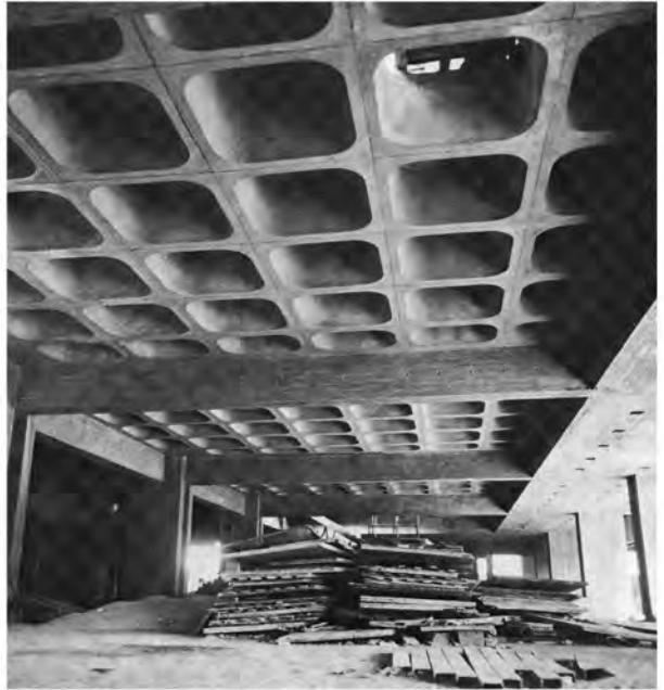
Treffend gegote beton-plafonne is 'n kenmerk van die foyers en wandelgange van die hele gebouekompleks

Striking concrete ceilings are a feature of the whole complex