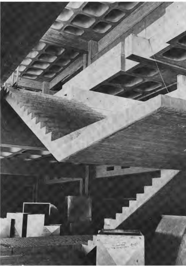
Trappe wat in die lug hang . . .