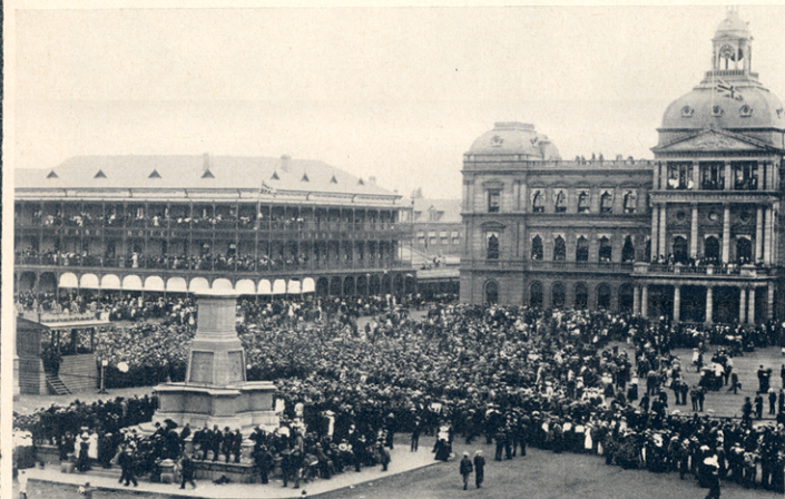
Die plein was nog altyd 'n ideale plek vir massabyeenkomste. In die ou dae is die Grand Hotel (links) dikwels druk besoek