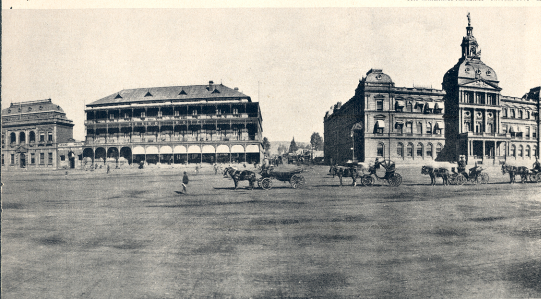
soos hulle destyds daar uitgesien het.