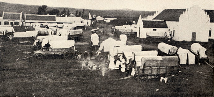
Die ou Trappengewelkerkie wat aan Kerkplein sy naam gegee het. Die tonnel toon Nagmaal soos dit in vervloë dae geïllustreer is.

weer was dit modderig, en in droë weer het die stofwolke daarop uitgeslaan.