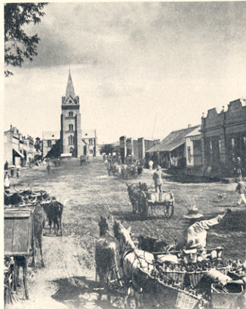
Onder: Trems het tot onlangs toe nog om die plein geloop

was swierig en modern vir sy tyd en het die Republiek se materiële vooruitgang weerspieël.