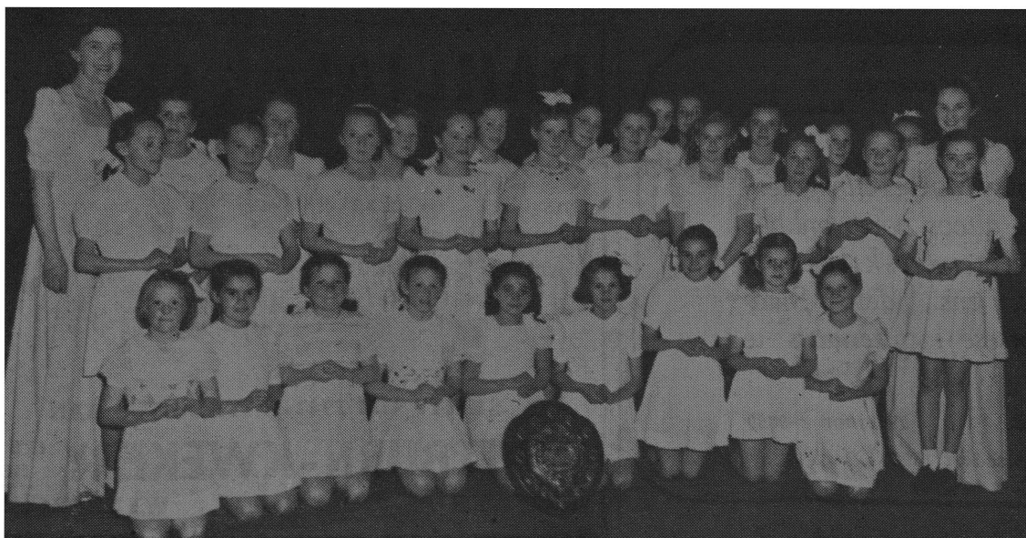
Links: Die koor wat Die Huisgenoot-skild verower het.

Gou is beseft dat deelnemers van die platteland beswaarlik in groot getalle aan 'n jaarlikse kunstwedstryd in Kaapstad sou kan meedoen, hoewel die aantal wat hulle wel die opoffering en onkoste getroos het, besonder bemoedigend was. Dit was derhalwe steeds die vurige