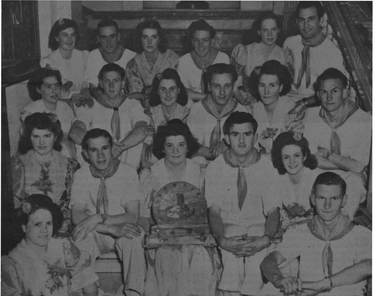
Die Oranje-Volkspeler van Matieland wat die Skild vir Volkspeler verower het.

Een van die eerste doelstellings van die Afrikaanse organiseerders was om belangstelling en waardering op te wek by volwassenes sowel as kinders vir Afrikaans as kultuurtaal. Vandaar die besluit om in die afdeling sang werke voor te skrywe van internasionaal-erkende kunstgehalte wat op Afrikaanse woorde gesing kon word. Hierdie beginsel word nog steeds gehandhaaf, sodat nie slegs die werke van Afrikaanse komponiste voorgeskrywe word nie.