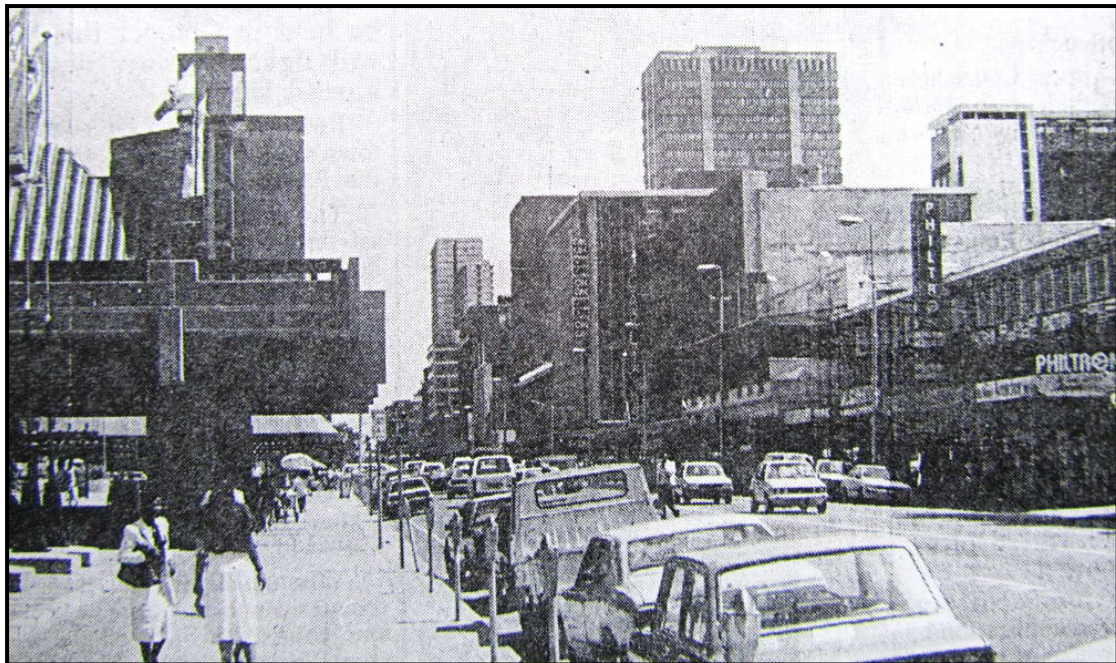
Church Street East, 1988

Other buildings down the street at the time housed bars, restaurants, a bottle store, a boot manufacturing company and auctioneers.