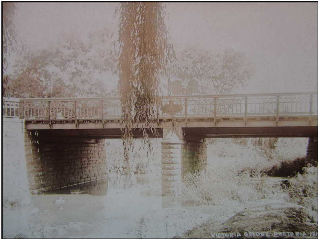
Poskaart Nummer 171. Uitgegeev deur SAPSCO Real Photo. Bus 5792. Johannesburg