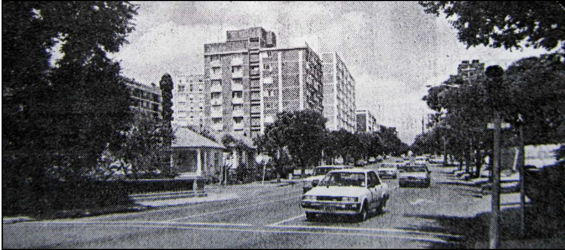
Victoria Bridge in 1988

----- Hier volg die geskiedenis van die Victoriabrug soos opgeteken in 'n Pretoriana tydskrif [Pr-98 p 43].