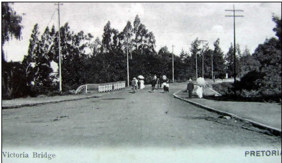
Poskaart nummer 100. B.F./C. Union Universelle Transvaal Gestuur op 29 December 1904

Ek besef nou eers die waarde van ou poskaarte. Net jammer hulle is so skaars.