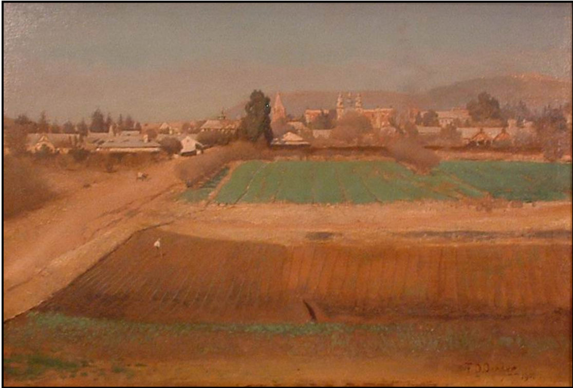
F.D. Oerder 1902

In die voorgrond is die tuine van Sanssouci en agter is huise in Boomstraat