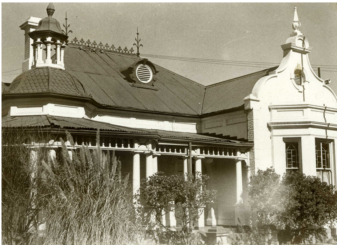
Die Chinese Skool in Boomstraat, Pretoria