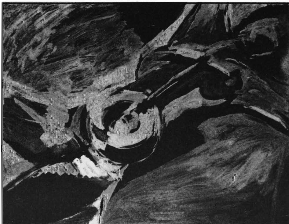
Afbeelding 3. Nel Erasmus: Acquiescence (ca. 1971). Reproduksie in Lantern , Vol. 36, 1987.

Nel Erasmus beskou kalligrafie as 'n wyse van vereenvoudiging waardeur die essensie van 'n objek of subjek aangedui kan word. 'n Kwasmerk is gelyktydig lyn en vorm. Dit het 'n