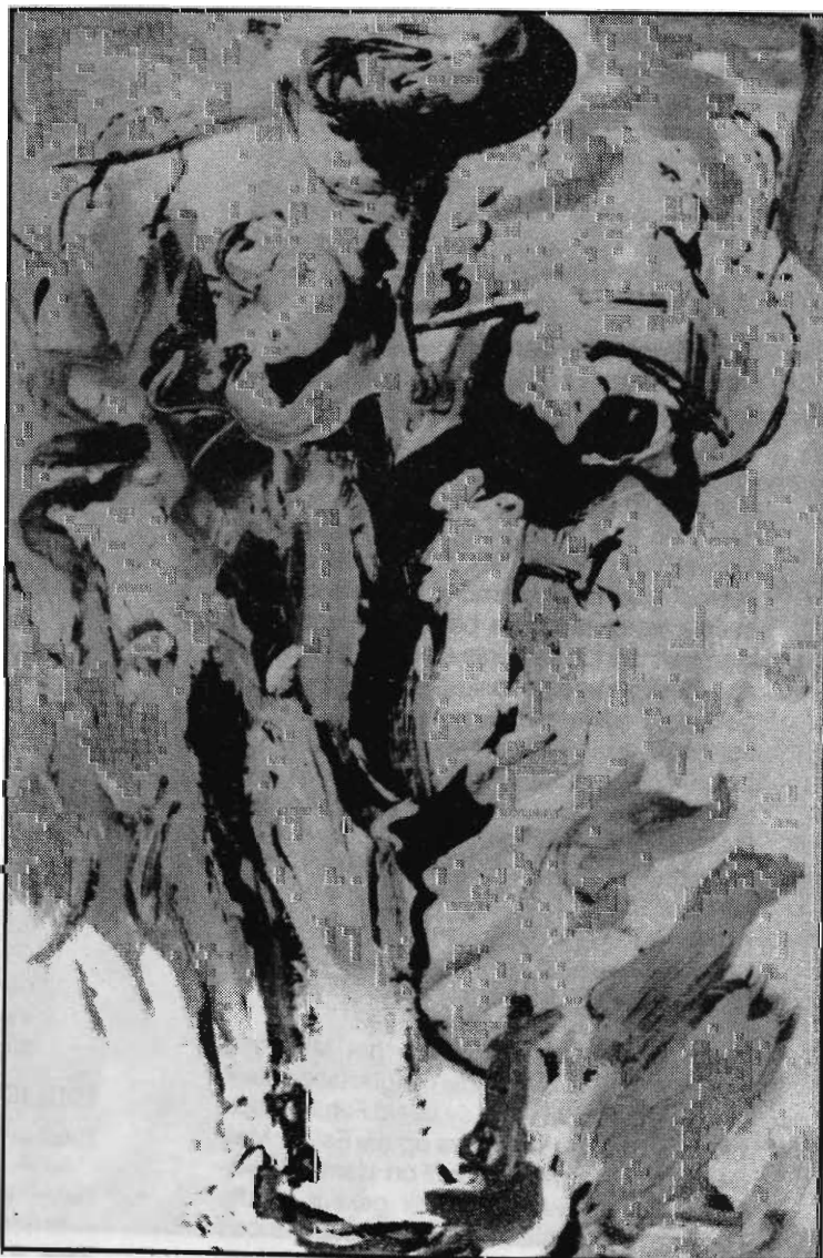
Afbeelding 1. Nel Erasmus: Jazz Baby/Spent Autumn (1991). Akriel op papier op bord, 100 X 68cm. Bloemfontein: Oliewenhuis-kunsmuseum.

die wêreld van die vorme vorme in die ruimte