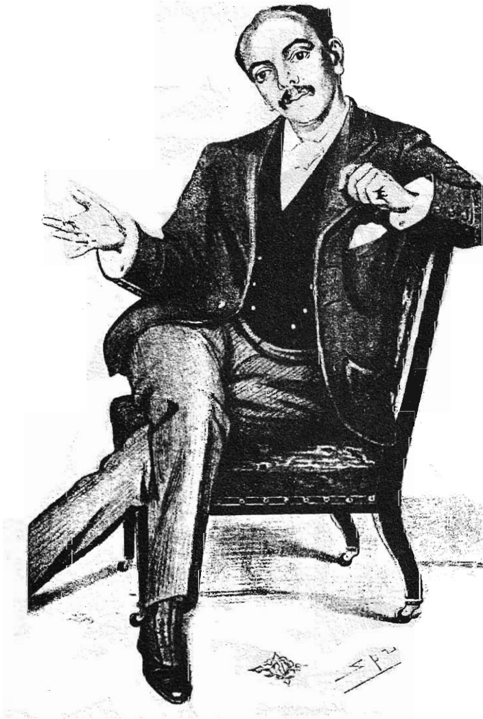
DR. JAMESON (From a cartoon by LESLIE WARD in Vanity Fair )