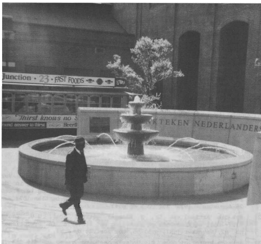
Monument vir Nederlandse immigrante tussen 1850 en 1950 in Transvaal gevestig, by die Tremloods aan Pretoriusstraat in Pretoria-Sentraal, deur die Staatspresident F.W. de Klerk onthul op 16 Februarie 1992; op die agtergrond staan 'n ou tremwa wat lank gelede in Pretoria diens gedoen het.