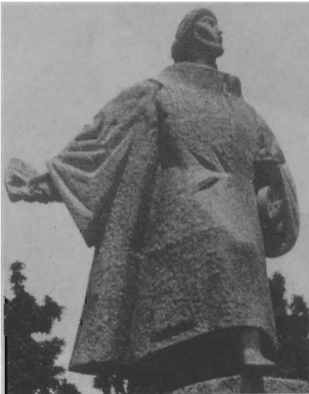
Standbeeld van Bartolomeu Dias in die Tuine van Kaapstad, in 1960 geskenk deur die regering van Portugal ter herdenking van die sterfjaar van Dom Henrique (Prins Hendrik die Seevader); die beeld is later by die hawe van Kaapstad geplaas.