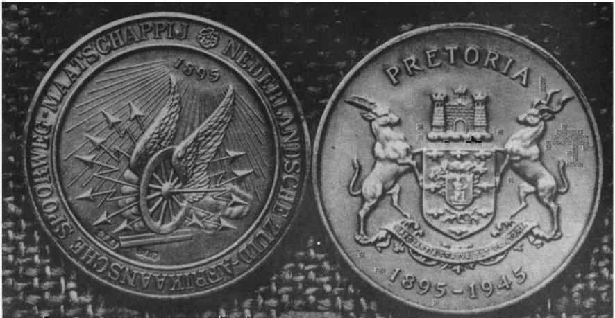
Gedenkpenning deur die Stadsraad van Pretoria in 1945 uitgegee ter herdenking van die opening van die Delagoabaaispoorweg in 1895 — links die embleem van die NZASM, regs die stadswapen van Pretoria

"Verslag der Nederlandsche Zuid-Afrikaansche Spoorweg-Maatschappij over het jaar 1890." Idem... 1891, idem... 1894. Amsterdam, s.j.