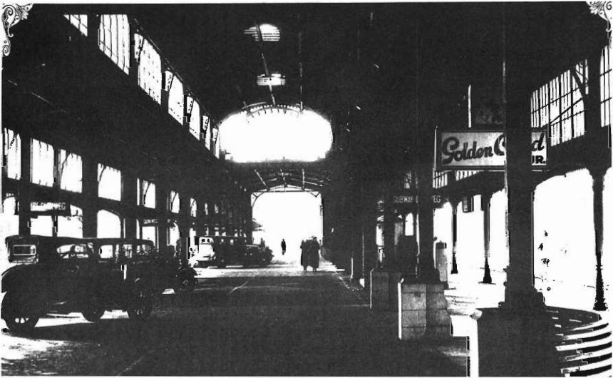
Ou foto van die NZASM se stasiehal in die hoofstasie te Johannesburg, in Nederlandse styl ontwerp deur Jacob Klinkhamer te Amsterdam, in 1952 oorgebring na die Spoorwegopleidingskollege te Esselenpark