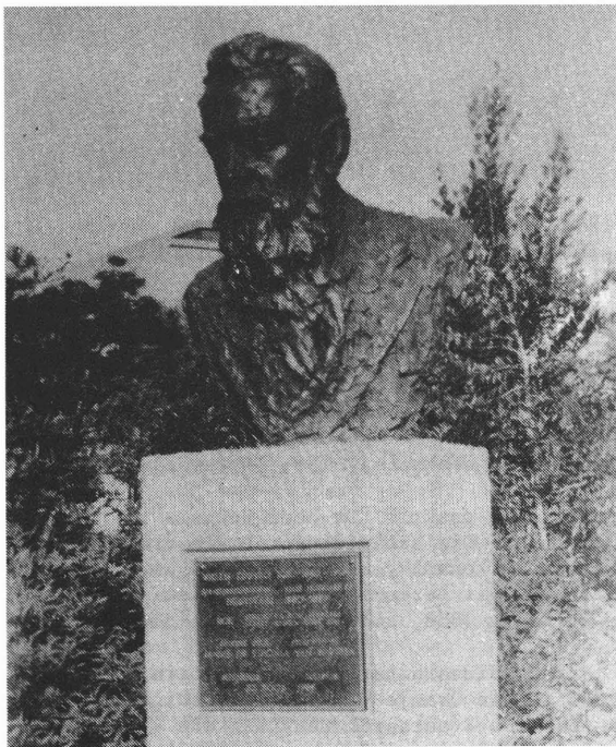
Borsbeeld van W.E. Bok, in 1986 te Pietersburg geplaas toe die dorp 100 jaar oud was.