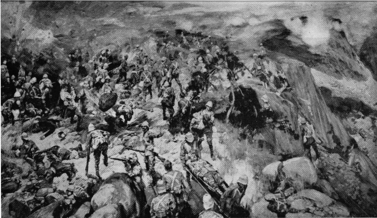
THE SCENE ON SPION KOP—MAJOR THORNEYCROFT'S DESPERATE SITUATION.

Drawing by Frank Craig from a Sketch by a British Officer.