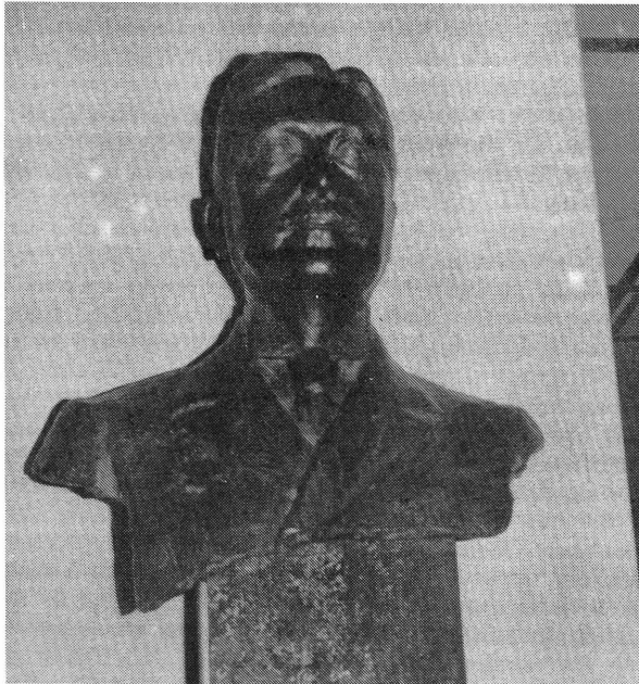
Borsbeeld in brons van Dr. W.J. Leyds in die Merenskybiblioteek van die Universiteit van Pretoria