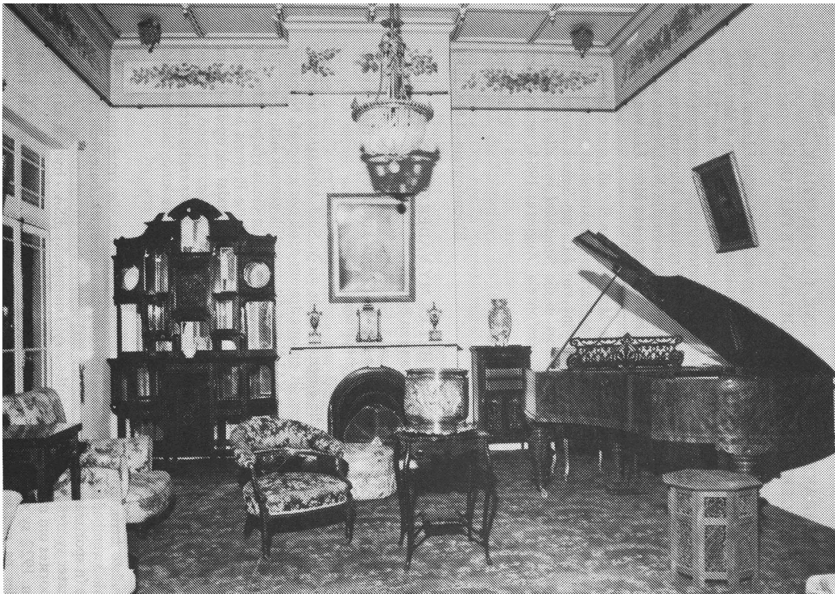
'n Deel van die groot ontvangs- en musiekkamer in SAMUEL MARKS se plaaswoning Swartkoppies ten ooste van Pretoria.