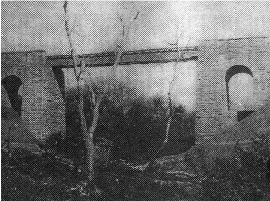
Die ou spoorbrug van die NZASM oor die Apiesrivier by Pretoria voor die aanlê van die Maria van Riebeeckweg in 1960-1961, vanuit die noorde gesien

Foto uit Gedenkboek uitgegeven ter Gelegenheid van de feestelijke opening van den Delagoabaaispoorweg , Amsterdam 1895