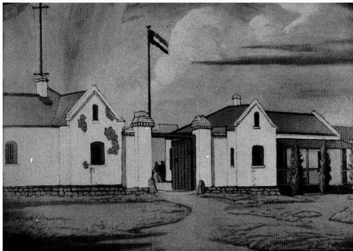
Die 2de Tronk in Pretoria 1880 h/v Visagie en Bosmanstrate