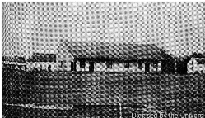
Suidwestelike h/v Pretorius en Paul Krugerstrate. Die eerste Tronk in Pretoria