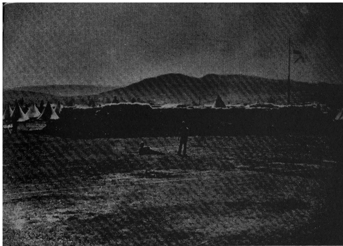
'n Fort in Pretoria tydens die beleg van 1880-1881.