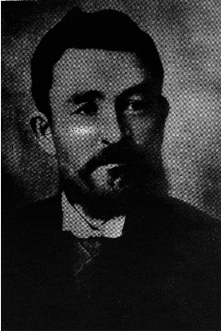
Genl. C.R. de Wet