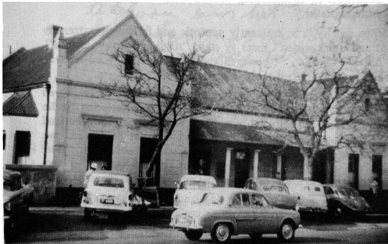
Genl. Piet J. Joubert Residence – 218 Visagie St. 1960