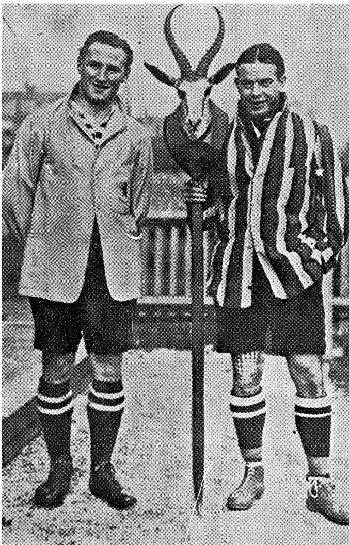
Goedgunstig geleen deur „Hoofstad”.