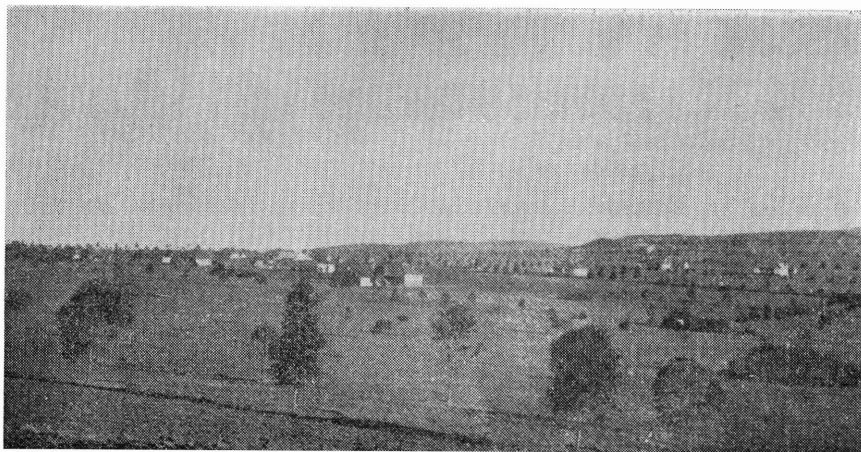
Portion of Waterkloof showing some of the houses.

search of recreation, or a picturesque beauty spot in which to enjoy peace and quietness.