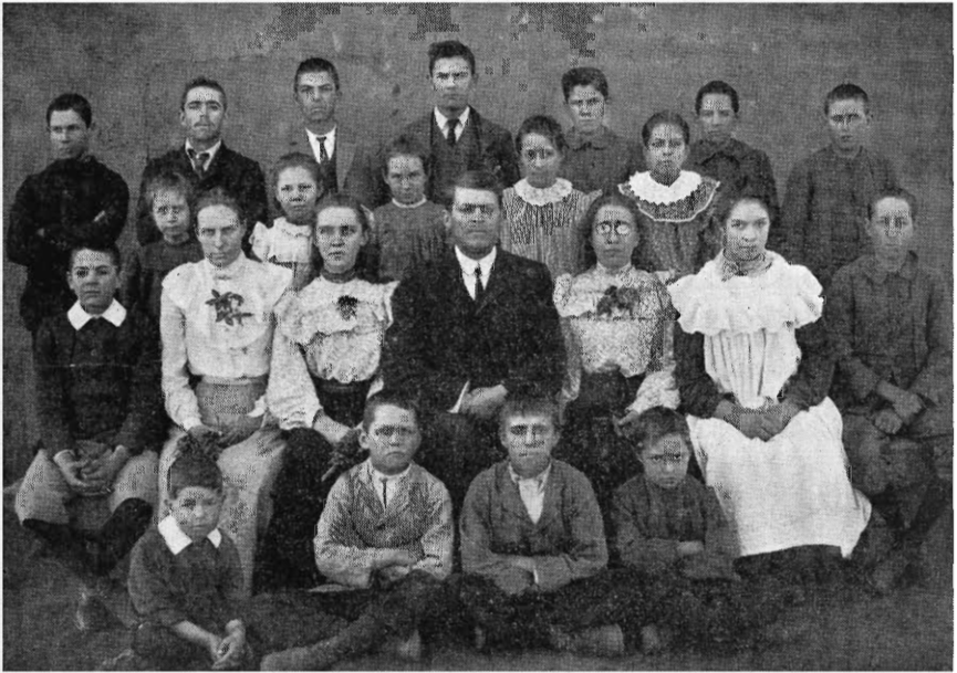
Wildebeesthoekskool, Distrik Pretoria, 1906

„Algemeene Geschiedenis”. „Aardrykskunde van Zuid-Afrika” en „Algemeene Aardrykskunde” was ook twee afsonderlike vakke. Die geskiedenis en aardrykskunde van die eie land is dus twee vol vakke. Die vak Natuurkunde en Delfstofkunde getuig van die waarde geheg aan die kennis van minerale in die Transvaalse Republiek as mynstaat. „Gymnastiek, Zang en Teekenen” word deur die student geneem, daar is egter ook voorsiening vir Viool, Harmonium en Slöjd. Verder is daar ook ’n waarderingspunt uit vyf van die leerling se „Gedrag en Vlijt” en „Orde en Netheid”. Omdat die kandidaat nou vir onderwyser leer verskyn daar ook punte vir Opvoedkunde en Praktiese Onderwys. Hierdie het op die vorige kwartaal se rapport ontbreek.