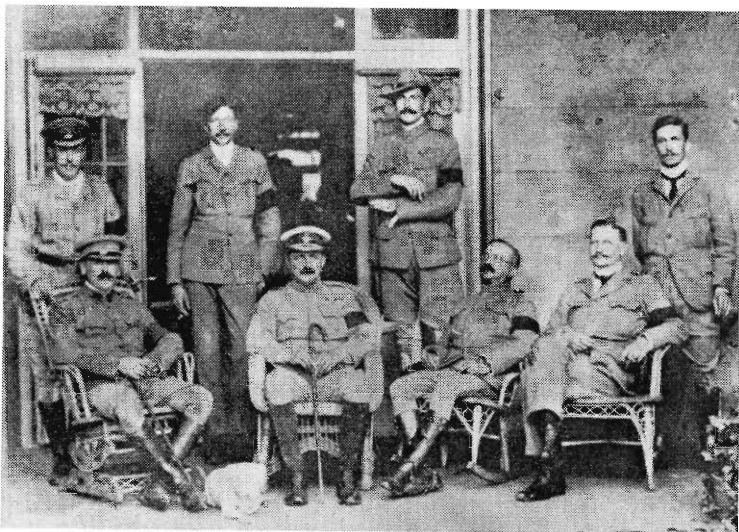
Personeel van die Militêre Goewerneur, sir J. G. Maxwell, op die stoep van die Britse Residensie, die tydelike woning van die Militêre Goewerneur.

posstukke deur die Geheime Speurpolisie van die Zuid-Afrikaansche Republiek. Hierdie inspektering van Britse posstukke lei tot 'n spesiale reëling met die Staatssekretaris van die Transvaal vir die versending van pos op Vrydae. 16)