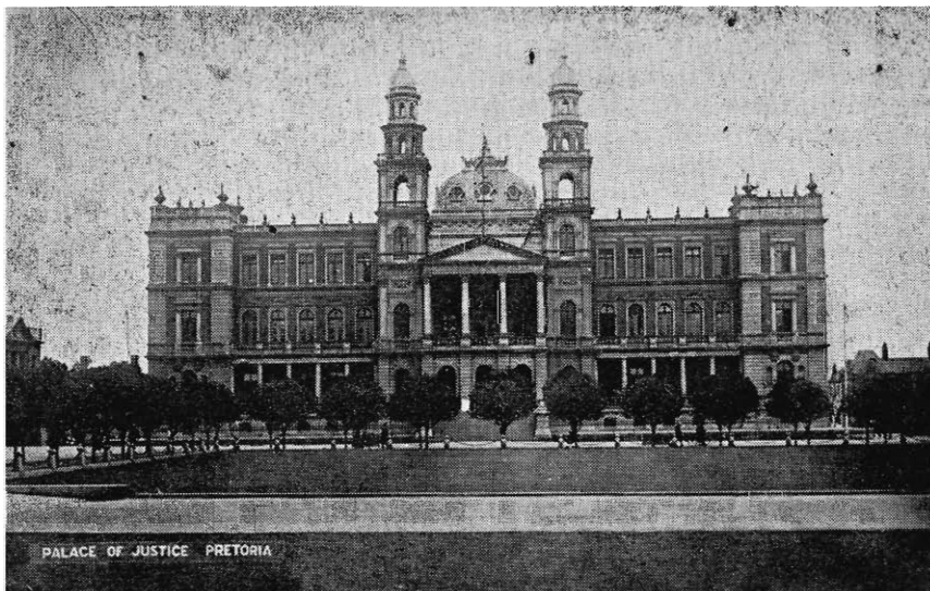
Vooransig Paleis van Justisie. Front view Palace of Justice.