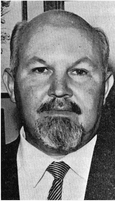
H. M. REX 1966

damse Beursgebou. Die firma het handel gedrywe in grafiese masjinerie en materiale.