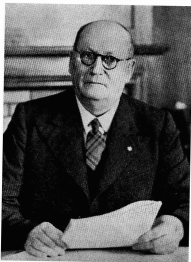
DR. D. F. MALAN

Toe die Nasionale Party van generaal Hertzog in 1924 aan bewind kom, het baie dit gesien as 'n mylpaal op die weg van 'n onafhanklike Suid-Afrikaanse Republiek. Tog is die strewe na 'n republiek ook binne die partygeledere op die agtergrond gehou weens die Pakt-ooreenkoms met die Arbeidersparty van kolonel Creswell. Ook het die geslaagde onderhandelings wat generaal Hertzog gevoer het om die selfstandigheid van