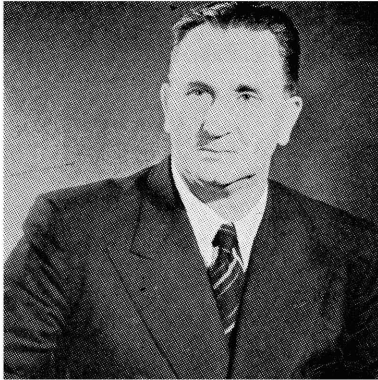
ADV. J. G. STRYDOM

Na die Nasionale Party in 1948 aan bewind gekom het, is die republikeinse strewe stelselmatig benader. Op die Statebondskonferensie van 1949 is op aandrang van dr. Malan besluit dat 'n republiek binne die