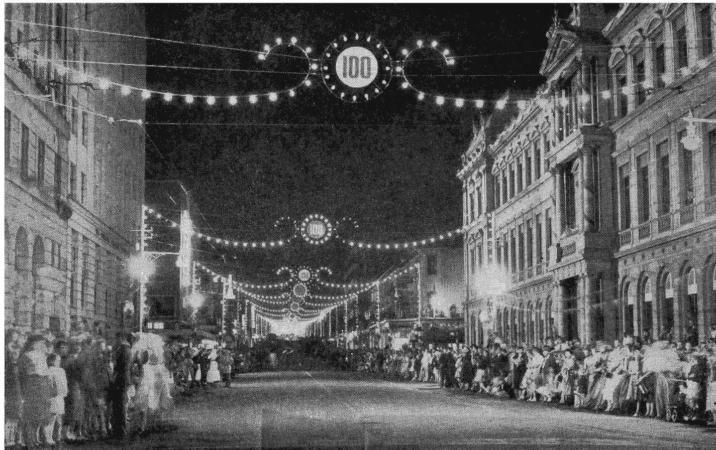
In Oktober 1955 het Pretoria sy honderdjarige bestaan herdenk. So is daar op die aand van 29 Oktober 1955 fees gevier. Pretoria Centenary Celebrations, October, 1955.