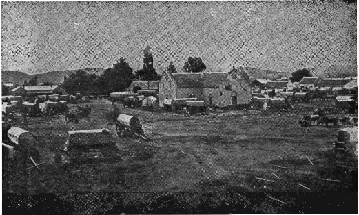
First Dutch Church erected on Church Square. This photo was taken in 1860. Die eerste kerk wat op Kerkplein opgerig is. Hierdie foto is in 1860 geneem.