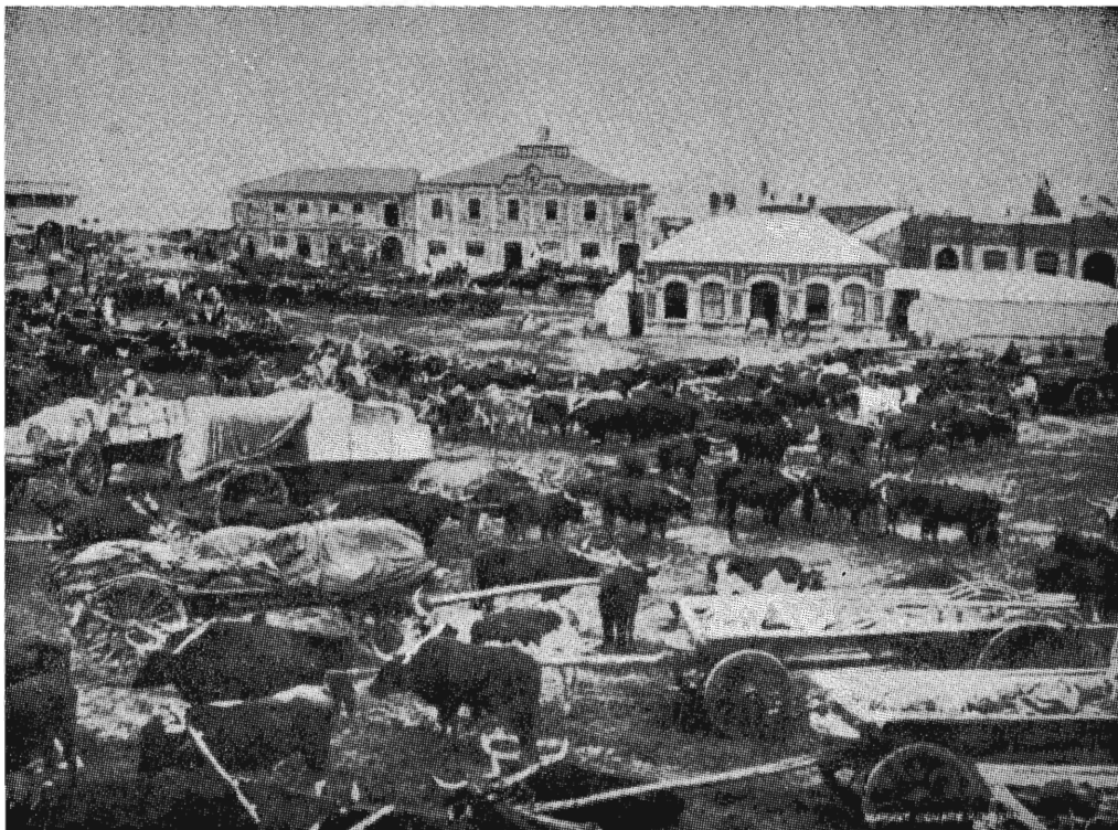
A busy day on Church Square in the 1880's. 'n Besige dag op Kerkplein in die tagtigerjare.