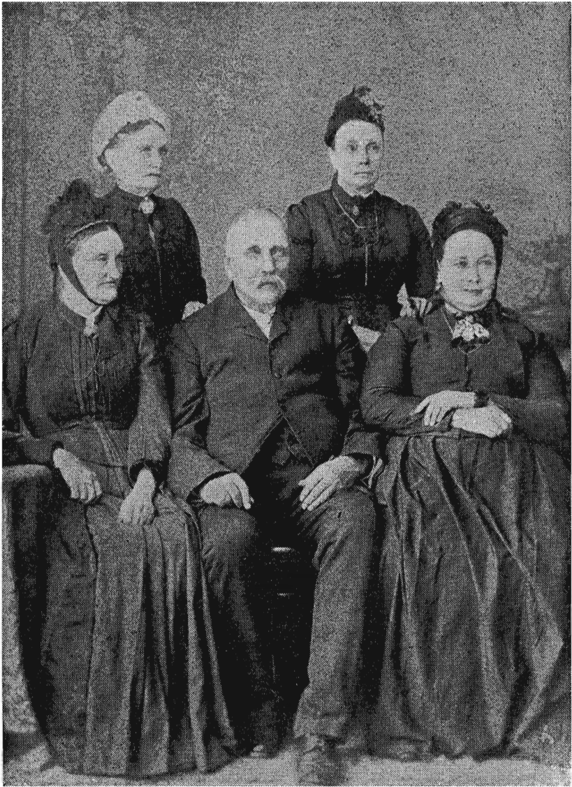
'n Seldsame foto van President M. W. Pretorius, stigter van Pretoria in 1855 en sy eggenote sittende links voor.

The founder of Pretoria, 1855. A rare photo showing President M. W. Pretorius, son of Andries Pretorius, and his wife sitting left front.