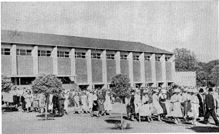
Die studente en dosente verlaat die terrein van die Gimnastieksaal na afloop van die roudiens.

„Van julle is selfs die hare van julle hoof almal getel.”