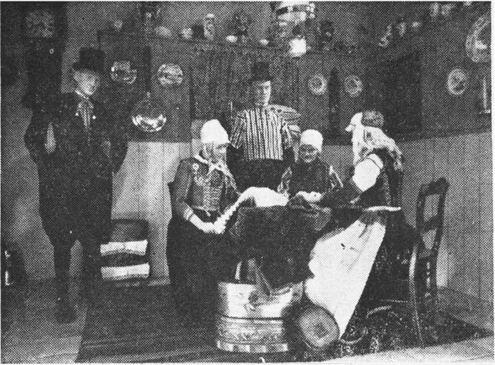
Bruiloftsdrachten Marken. 1910