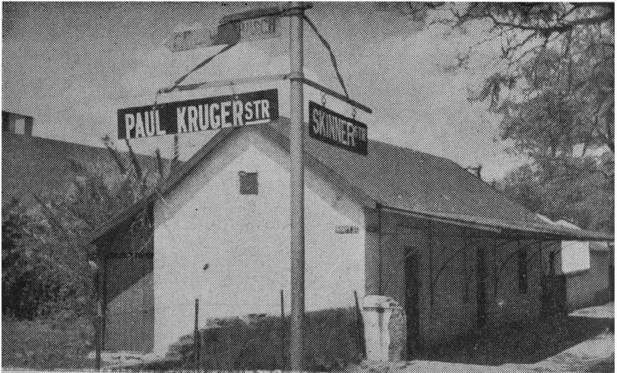
The oldest house in Pretoria. This house was built in 1866 by Bras Perreira. It is the intention of the Association Old Pretoria to re-erect this house near the Fountains Valley where in due course an open air museum will arise.

D IE oprigting van 'n opelugmuseum in Pretoria word deur die Genootskap Oud-Pretoria beoog. Op 22 Junie het verteenwoordigers van die Genootskap 'n komitee van die stadsraad om die aangeleentheid te bespreek, ontmoet. Daar word gehoop dat vanjaar nog finaliteit oor die saak bereik sal word, sodat die opelug-museum as blywende bydrae van die Genootskap Oud-Pretoria tot die stad se eeuefsviering kan dien.