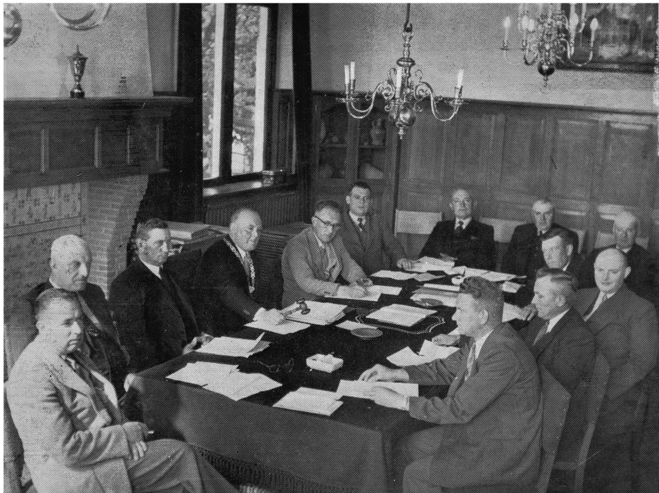
De Gemeenteraad van Oudorp in vergadering bijeen op Donderdag 4 Augustus 1955.