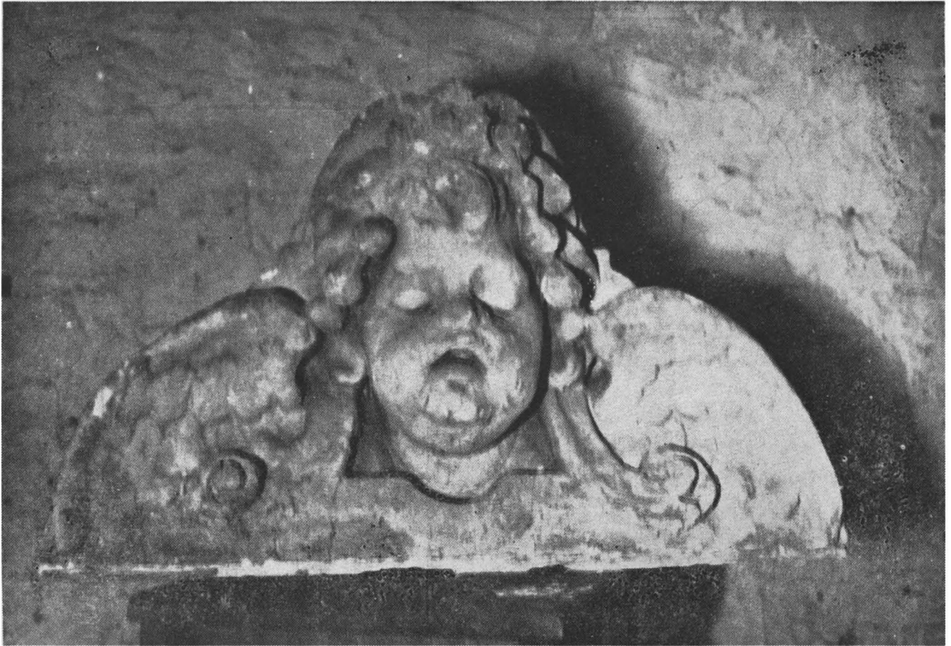
Een van die engelebeeldjies waarna in meegaande stuk verwys word