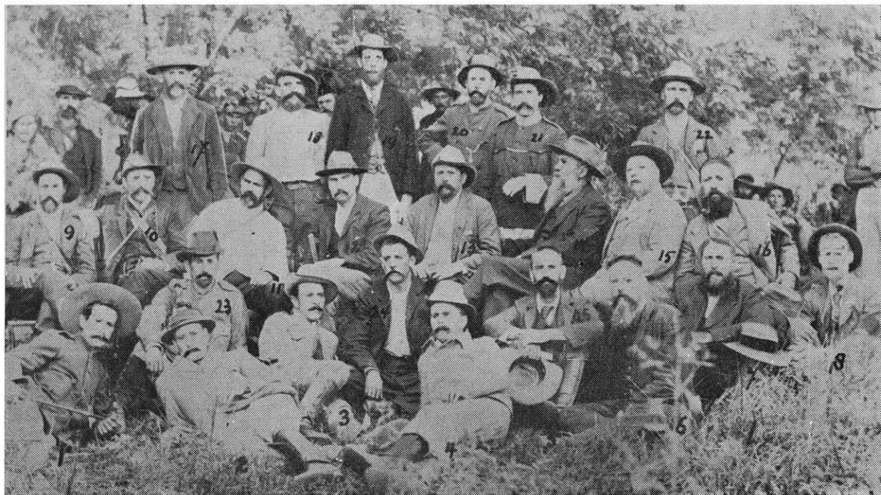
'n Groep Z.A.R. Offisiere uit die 1899—1902 oorlog; geneem in Swazieland.