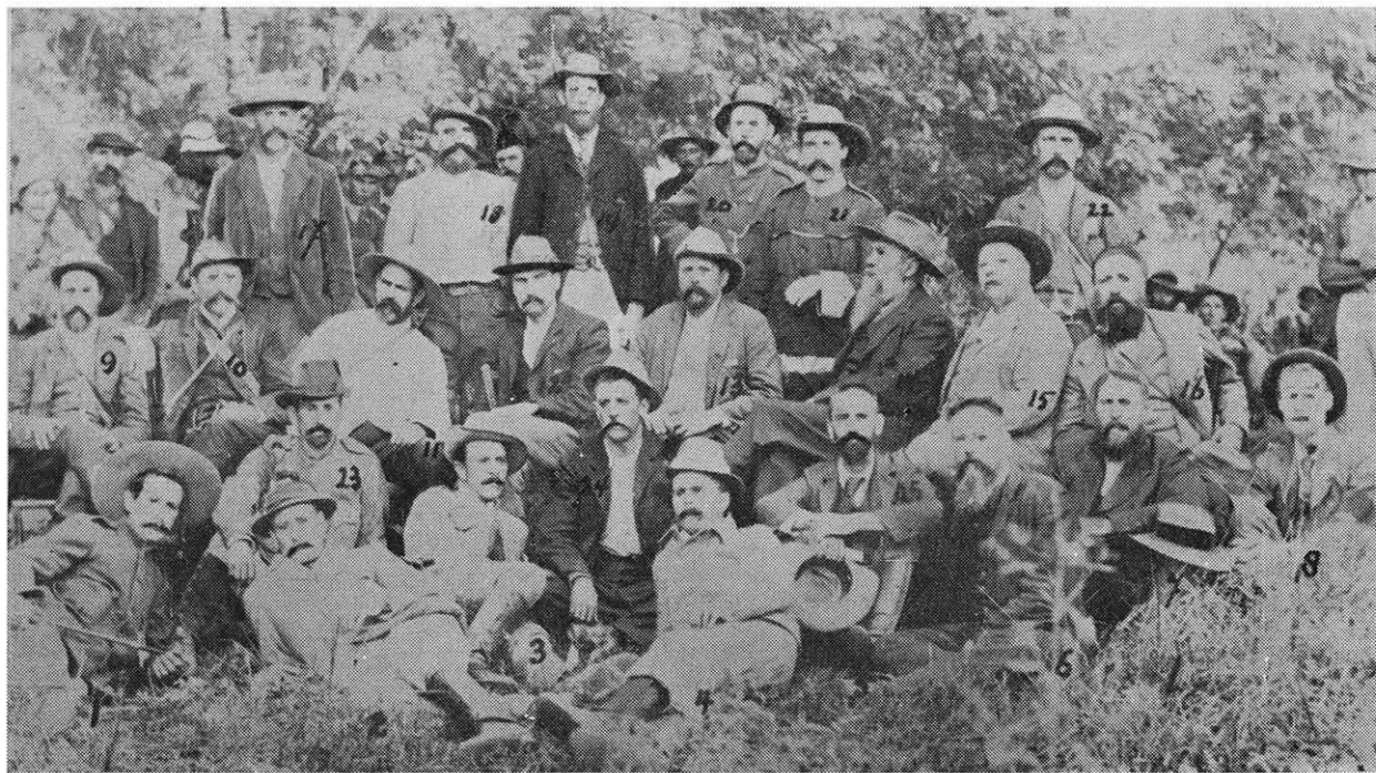
'n Groep Z.A.R. Offisiere uit die 1899—1902 oorlog; geneem in Swazieland.