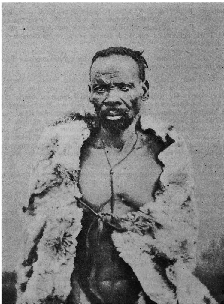
Sekhukhune in Pretoriase Gevangeniss. 1880.