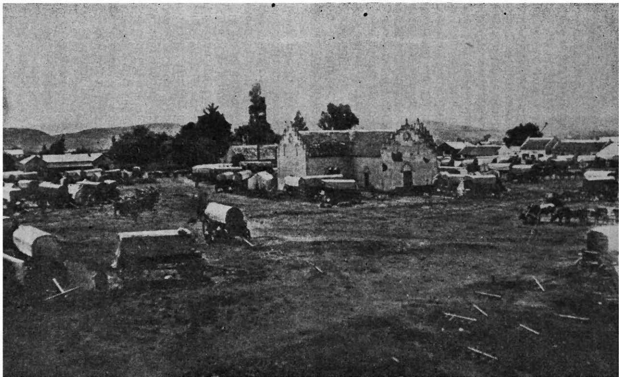
The Transvaal Republic. Old Pretoria: First Dutch Church erected on Church Square. This view was taken in 1860. (Album D, No. 10.)