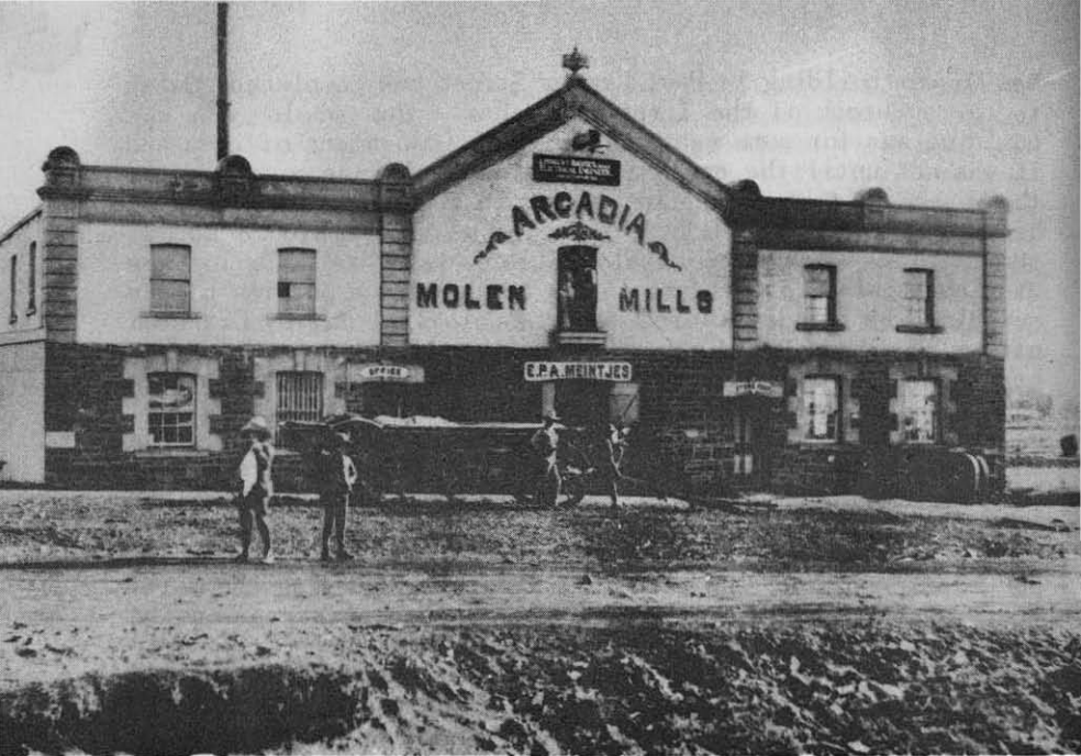
'n Bekende gebou van Ou Pretoria: Meintjes se Meul. A well-known landmark of Old Pretoria: Meintjes' Mills.