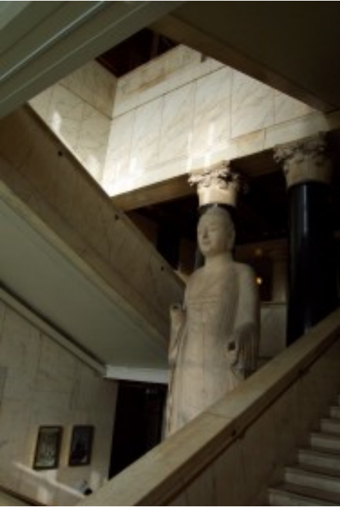
Foto 20. Monumentale kultuurkeppinge soos hierdie Sjinese beeldhouwerk word in die Britse Museum uitgestal. Terug na Inhoud