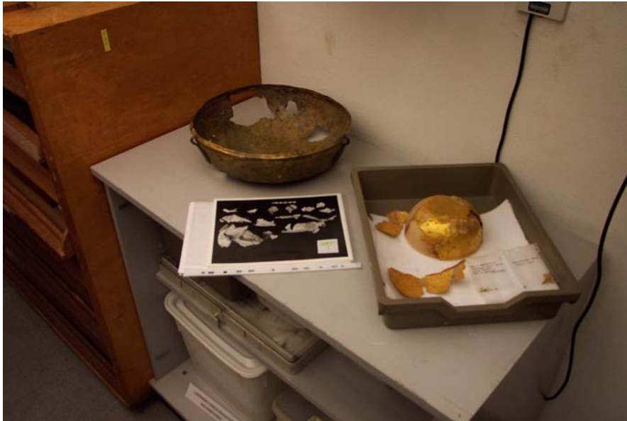
Foto 3. Die Mapungubwebak en ander metaalvoorwerpe in 'n beveiligde bewaarkamer van die Britse Museum.