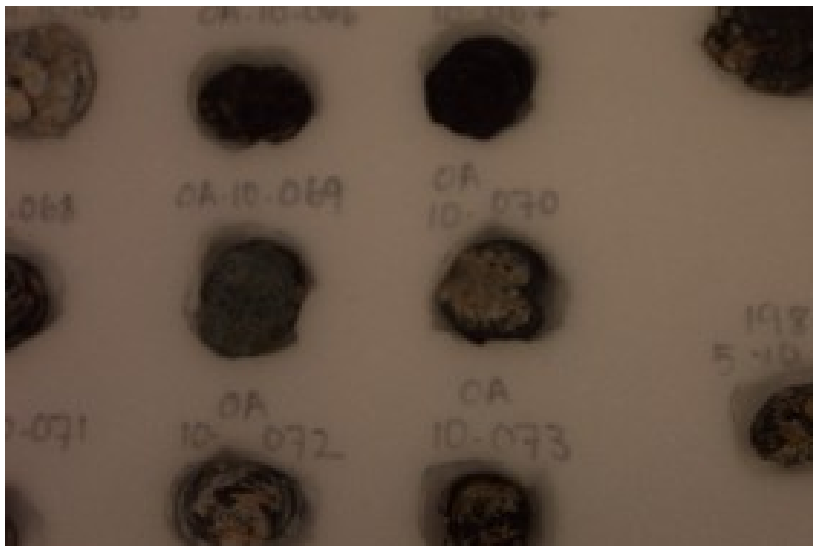
Foto 15. Die herkoms- en identiteitbesonderhede van elke voorwerp word by die voorwerp aangeteken.