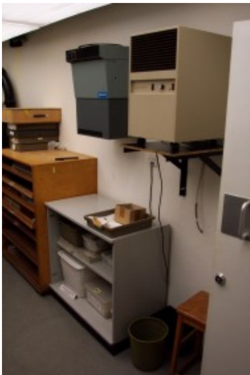
Foto 4. Die voggehalte in die bewaarkamer word deur middel van vogreëlaars beheer.