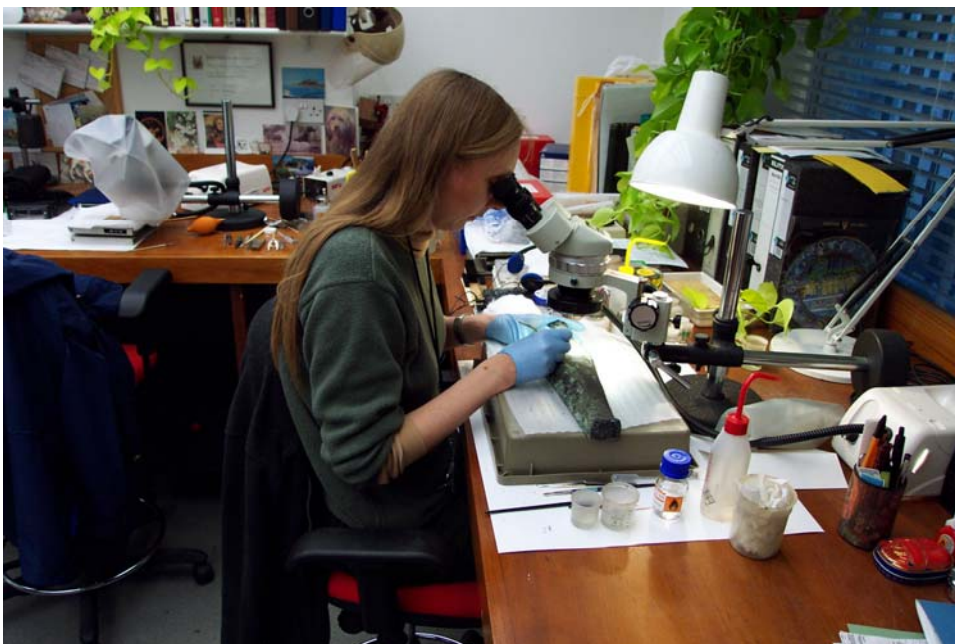
Foto 6. Die konservering van kultuurvoorwerpe en materiale word met behulp van gespesialiseerde toerusting en chemikalieë in toegeruste laboratoriums gedoen.