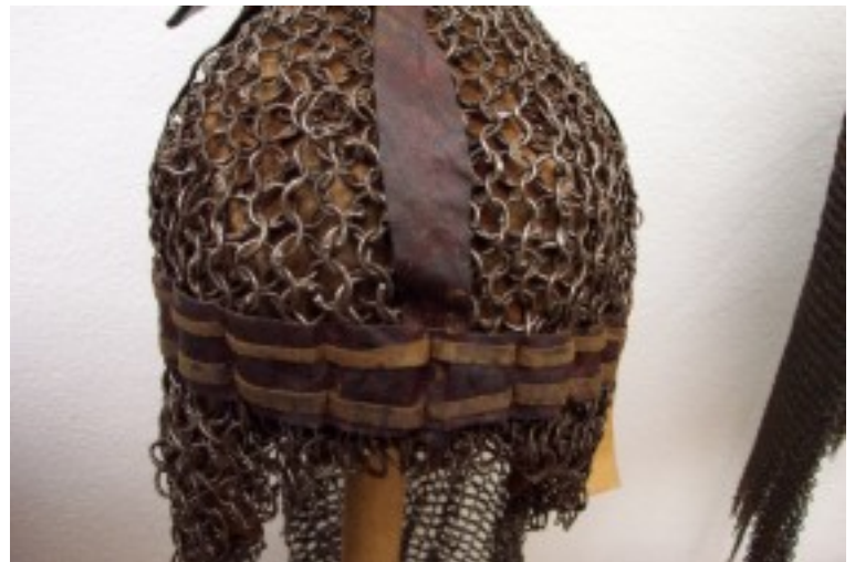
Foto 19. Besondere kenmerke van voorwerpe soos hierdie kryghelmet moet tydens restourasie geïdentifiseer, gedokumenteer en bewaar word. Die kenmerke is onder andere die struktuur daarvan, wyse van vervaardiging, materiale wat gebruik is asook tipologiese kenmerke wat kenmerkend is van 'n spesifieke kultuur, gebied en tydperk.