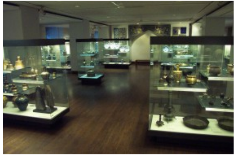
Foto 21. Spesifieke versamelings soos hierdie Islamitiese kuns- en kultuurvoorwerpe word in verligte glaskaste uitgestal. Inligting oor die genoemde voorwerpe is in brosjures beskikbaar. Terug na Inhoud