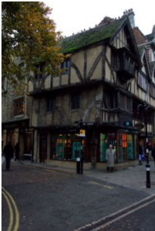
Foto 30. Die gerestoureerde Middeleeuse woning word bewaar as tasbare getuienis van vroeë sosiale en kultuurlewe in Oxford en terselfdertyd volhoubaar benut in 'n moderne stadsomgewing Terug na Inhoud