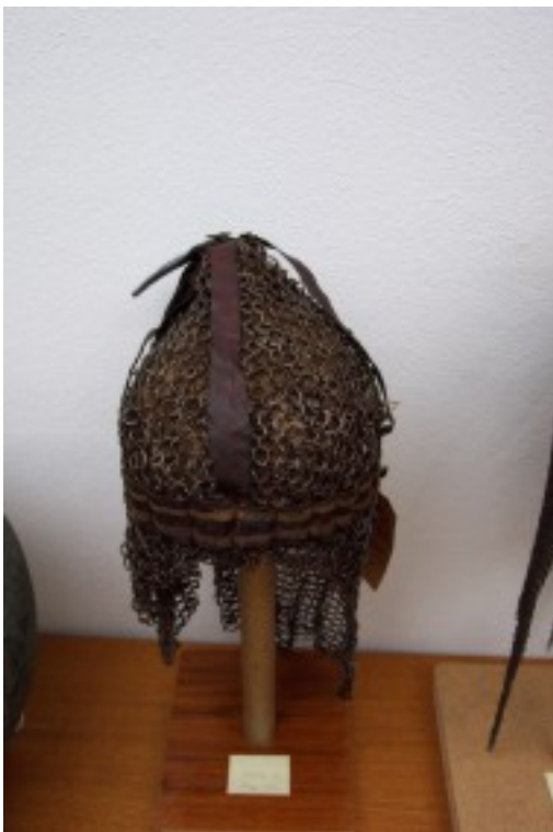
Foto 18. 'n Gerestoureerde kryghelmet uit Noord-Afrika in gekontroleerde bewaringstoestand in die bewaarkamer.