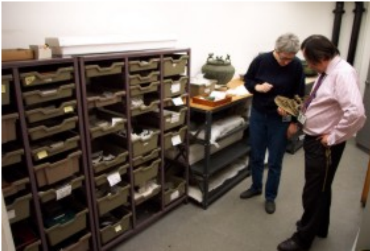
Foto 11. Kultuurvoorwerpe word in die bewaarkamer bewaar in oop plastiek-skuiflaaie ten einde die voggehalte, temperatuur en suurgehalte in die lokaal te beheer. Terug na Inhoud