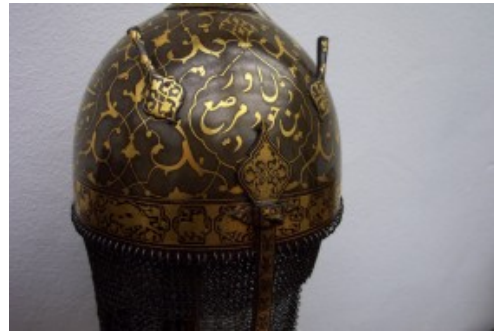
Foto 17. 'n Naby-aansig van die gerestoureerde Islamitiese kryghelmet. Besonderhede van die historiese konteks, tipologie en ander kenmerke word deur deskundiges gedokumenteer en in wetenskaplike en populêr-wetenskaplike publikasies bekendgestel.