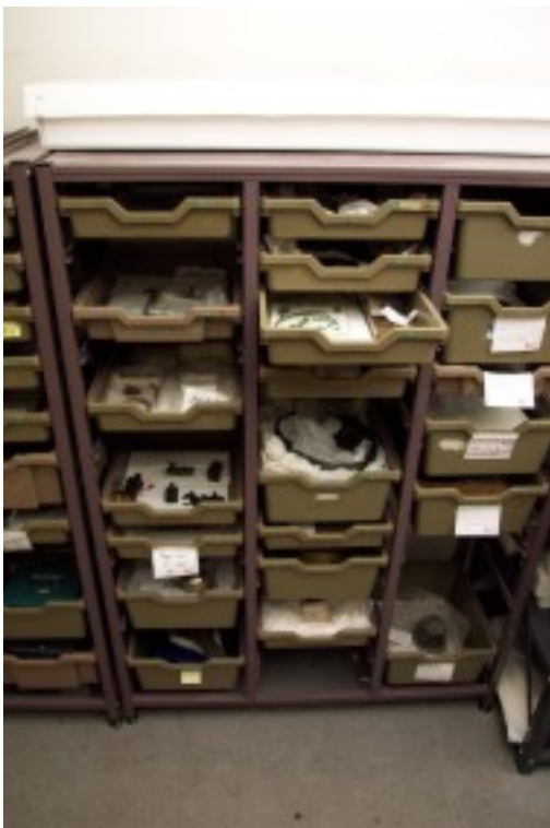
Foto 12. Die skuiflaaie word gemerk met behulp van etikette met inligting oor die kultuurvoorwerpe in die betrokke laai. Terug na Inhoud