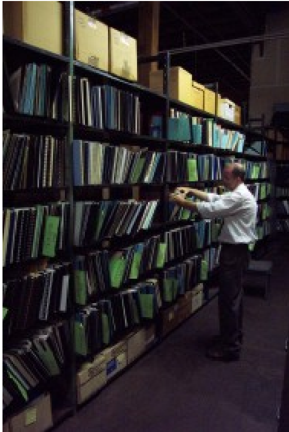
Foto 34. Die Federale rekords van argeologiese vindplekke by UK. Terug na Inhoud