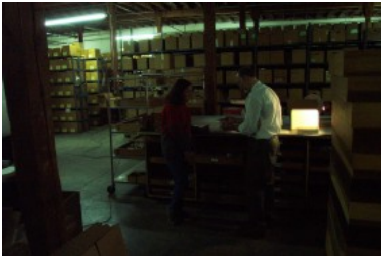
Foto 32. 'n Gedeelte van die argeologiese versameling van UK.