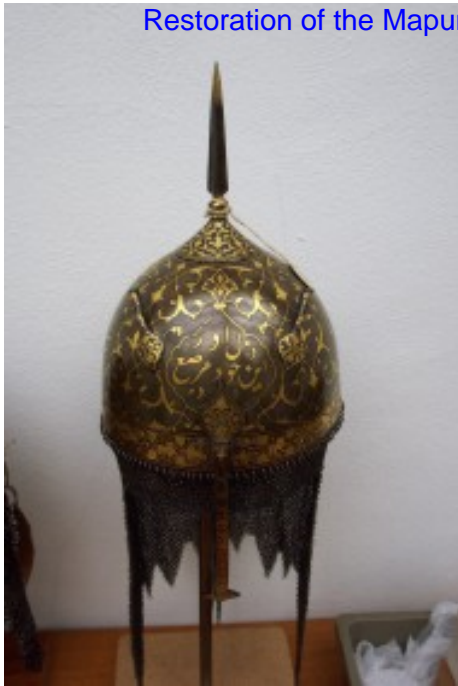
Foto 16. 'n Islamitiese kryghelmet word op 'n staander in die bewaarkamer gehou.