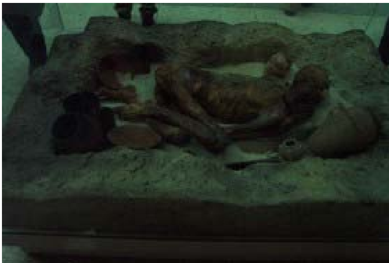
Foto 25. Oorblyfsels van prehistoriese mense en kulture soos hierdie antieke graf uit Noord-Afrika demonstreer op 'n boeiende wyse aspekte van die vroeë geskiedenis van Afrika. Terug na Inhoud