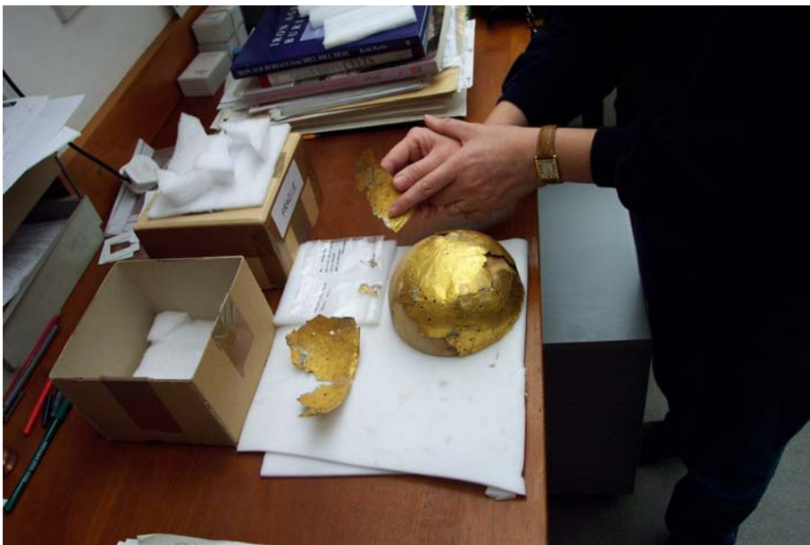
Foto 2. Heelwat gespesialiseerde konserveringswerk sal gedurende 2001 aan die Mapungubwe-bak gedoen moet word.