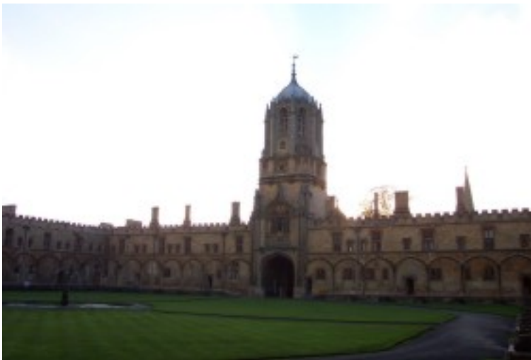
Foto 27. Die Tom Toring met ingang na die Christ Church-Katedraal en Kollege in Oxford.