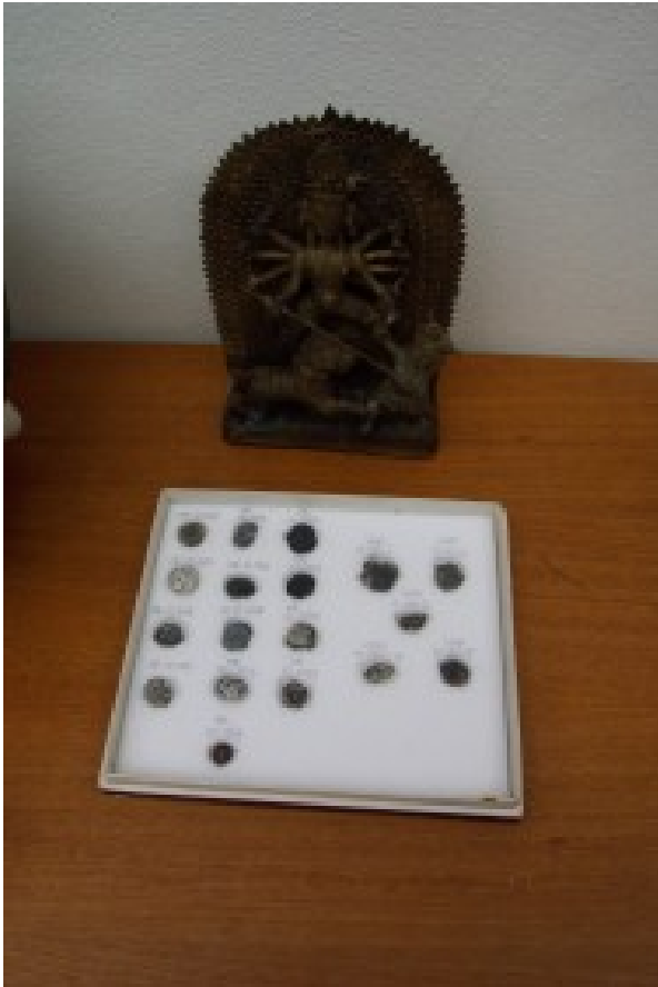
Foto 14. Kleiner voorwerpe langs mekaar word verpak in plat houers met suurvrye verpakkingsmateriaal.