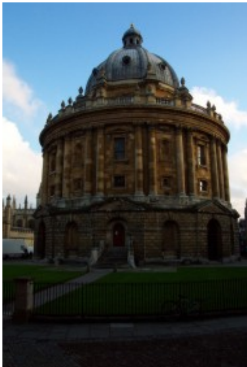
Foto 28. Die Radcliffe Camera leeskamer en biblioteek, deel van die nabygeleë Bodleian Biblioteek in Oxford. Dié biblioteek is die wêreld se grootste akademiese biblioteek met meer as ses miljoen boeke. Biblioteke en leeskamers is prominente akademiese fasiliteite by die kolleges