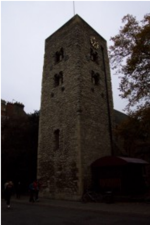
Foto 29. Die Angel-Saksiese toring is getuienis van Middeleeuse argitektuur in Oxford. Terug na Inhoud