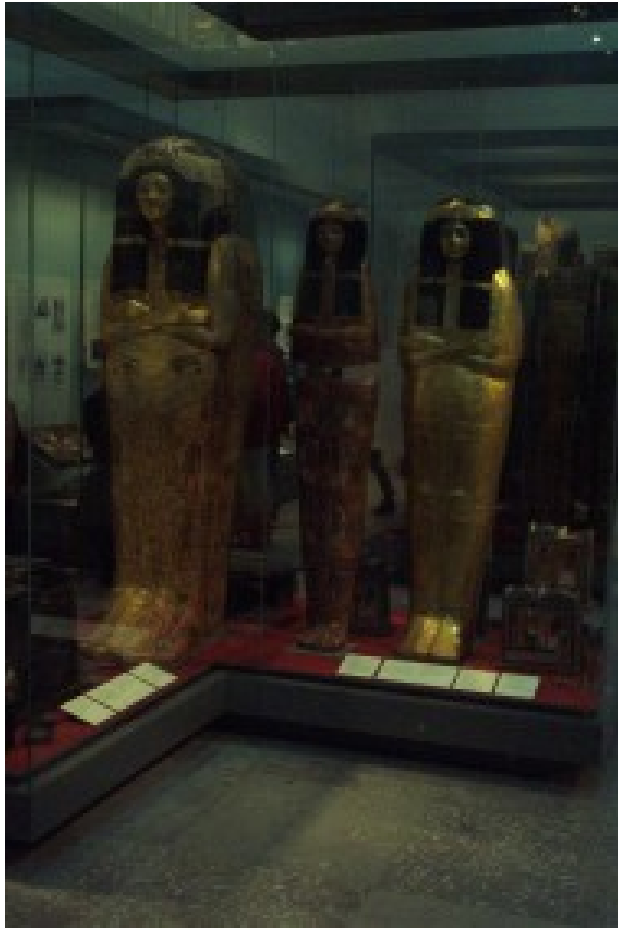
Foto 24. Die versameling kultuurvoorwerpe uit antieke Egipte wat in die Britse Museum gehuisves word, word druk deur skolegroepe en toeriste besoek. Deur middel van hierdie uitstalling word interessante en insiggewende inligting oor die mense en kulture van die Egiptiese beskawing aangebied. Terug na Inhoud