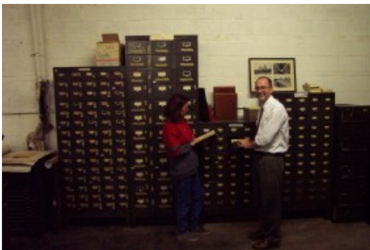
Foto 33. Die argeologiese katalogusrekords van UK.