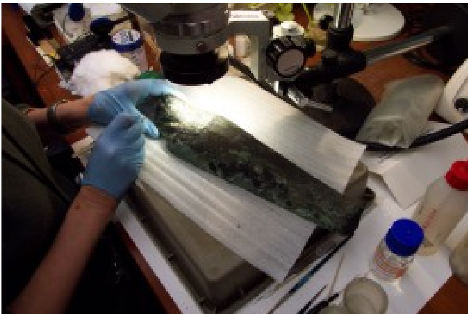
Foto 8. 'n Egiptiese beeldjie word noukeurig skoongemaak en die toestand daarvan gestabiliseer.