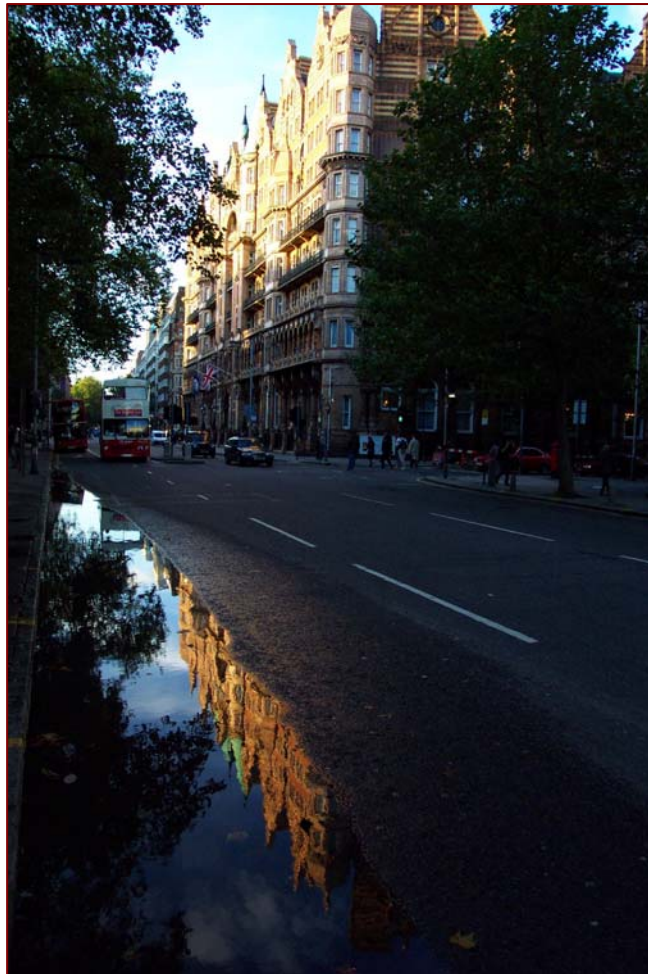
Historiese geboue in Southamptonstraat naby die Britse Museum in London, Oktober 2000