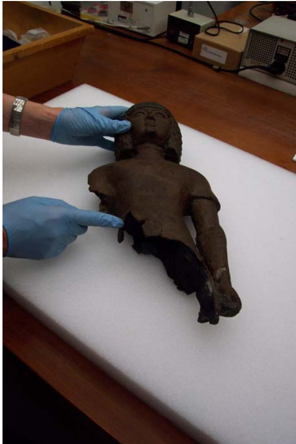
Foto 7. Kultuurvoorwerpe word versigtig met handskoene op sagte kussingmateriaal hanteer.