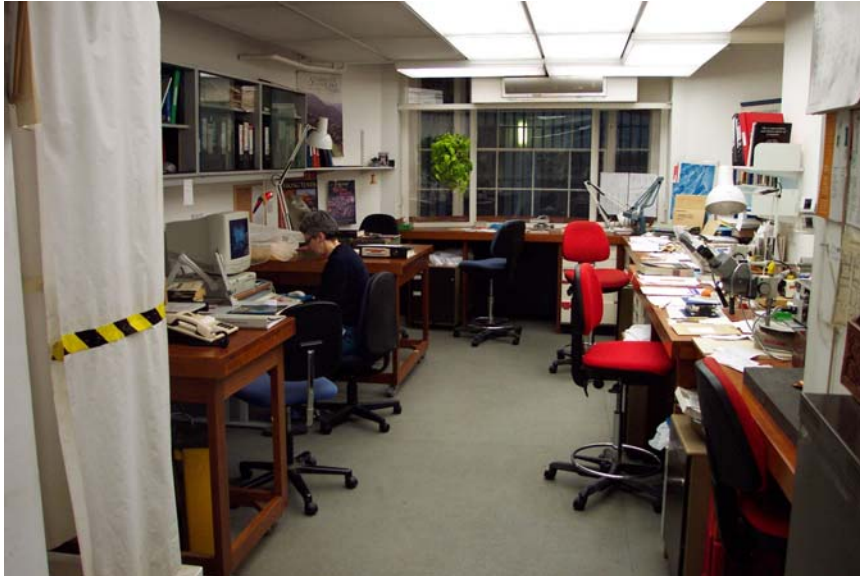
Foto 9. Dokumentasiefasiliteite, -standaarde en –prosedures in die Britse Museum word volgens internasionale vereistes bedryf.