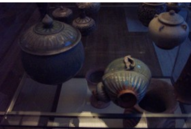
Foto 23. Inligting oor kultuurvoorwerpe soos hierdie celadonware uit die Sjinese Song Dinastie is van besondere belang vir navorsers en studente. 'n Deskundige van die Britse Museum het voorheen fragmente van Song Celadonware wat op Mapungubwe gevind is, geïdentifiseer. Terug na Inhoud