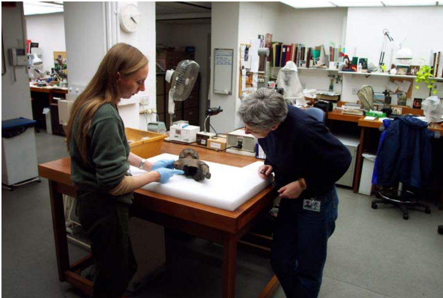
Foto 5. Spesialis-konserveerders in die Britse Museum ondersoek 'n antieke beeld in hulle laboratorium.