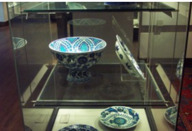
Foto 22. Die skadelike effek van vloervibrasies op kultuurvoorwerpe word verminder deur die stabiliserende effek van die hangblad waarop voorwerpe soos hierdie Islamitiese keramiekbak uitgestal word. Terug na Inhoud