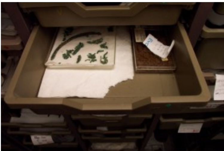
Foto 13. Kultuurvoorwerpe en -materiale word bewaar in en op suurvrye verpakkingsmateriale. Terug na Inhoud