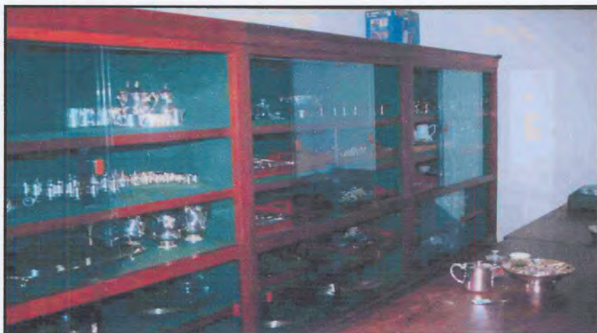
Figuur 58: Die silwerwarekluis in Libertas.

In afwagting van die nuwe silwerware vir Libertas, is besef dat die bestaande silwerwarebrandkluis onvoldoende was. Tekeninge van voorstelle vir 'n nuwe brandkluis ter waarde van £920 is aan die Eerste Minister vir goedkeuring voorgelê (fig.58). 60 Die Eerste Minister het die volgende maand reeds toestemming vir die voorgestelde verbeteringe gegee. 61