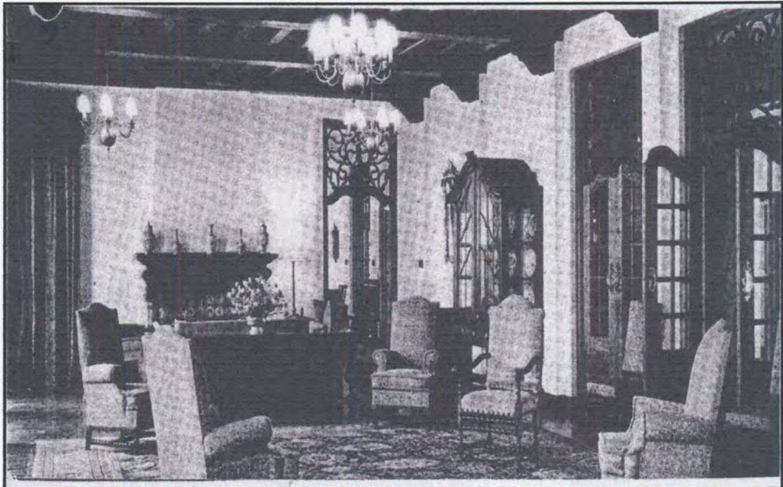
Figuur 57: Die kwaatkamer in die tyd van Malan.

Die veiligheid van die inwoners van Libertas is verseker deur wagte wat in die aand buite die ampswoning gewaak het. Gedurende die dag was daar slegs wagte by die hekke. Lae muurtjies en plante was die enigste ander veiligheidsmaatreëls. Daar was geen hoë veiligheidsheining om Libertas se terrein nie. 56