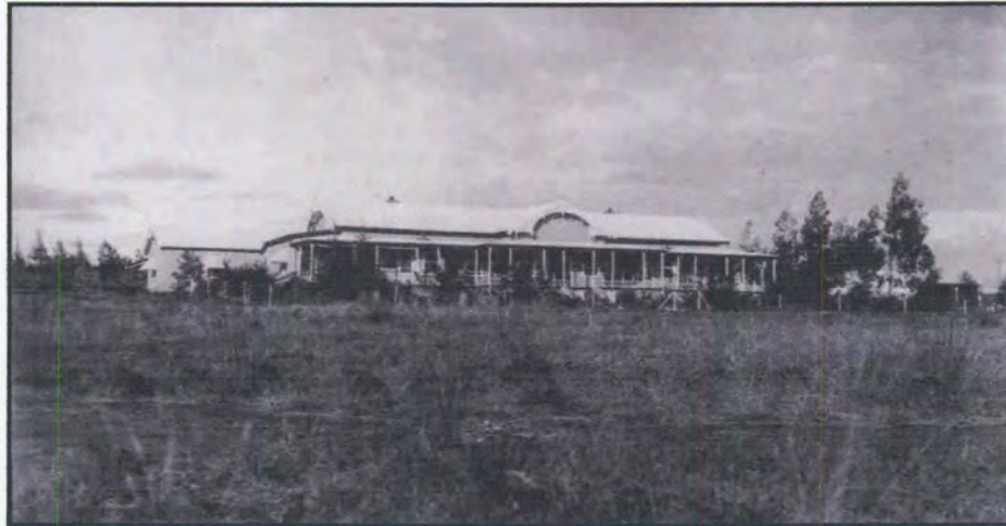
Figuur 43: Die woning op Doornkloof kort na die aankoop daarvan in 1909.

onophoudelik en luid en dit het voorgekom asof al die inwoners van die woning so daarvan gehou het. 9