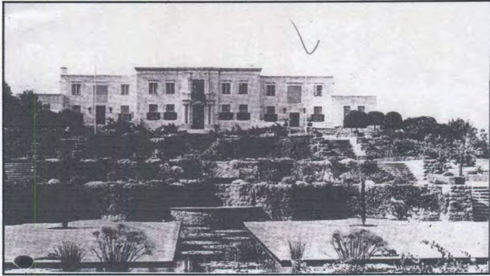
Figuur 55: Libertas in die tyd van Malan.