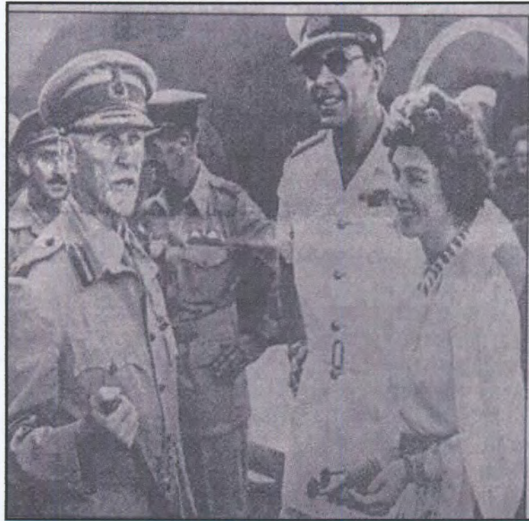
Figuur 52: Smuts saam met prinses Frederika en haar man, kroonprins Paul.

Staatjie lui dat mev Smuts vir Frederika oor die vingers getik het omdat sy die verwarmer te naby die beddegoed geplaas het en omdat sy te skraps gekleed geslaap het! 107