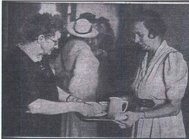
Figuur 47: Mevrou Smuts by die viering van Libertas se voltooiing, 1940-11-21.

Uit: NASA, Pretoria A1 Smutsversameling: Rand Daily Mail , 1940-11-22.