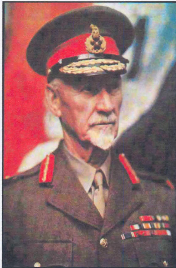
Figuur 42: Generaal J.C. Smuts.

Generaal JBM Hertzog het nooit die nuwe eerste-ministerswoning bewoon nie omdat die voltooiingsdatum daarvan eers tydens die bewindstyd van generaal JC Smuts was (fig. 42).