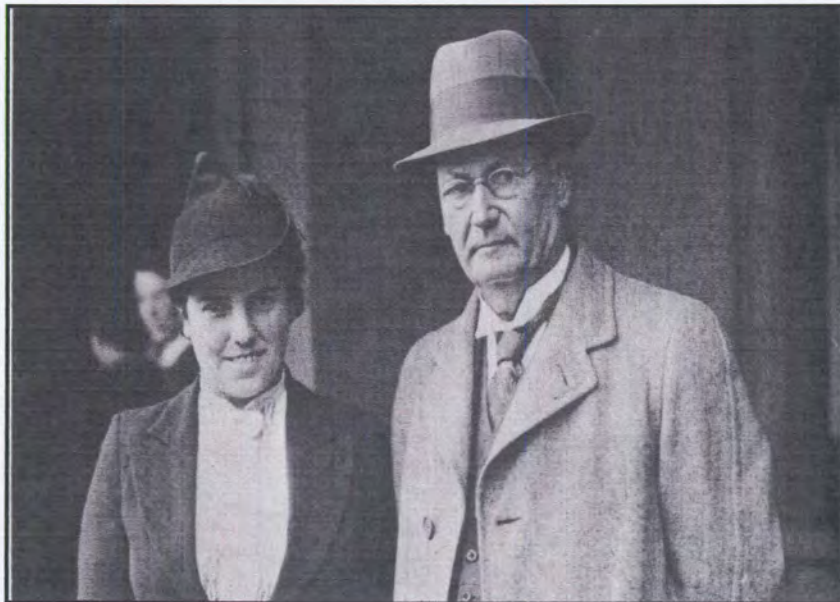
Figuur 53: Dr D.F. Malan en mev Malan.