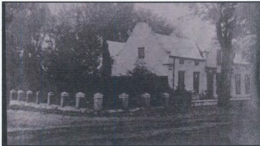
Figuur 46: Mevrouw Smuts se ouerhuis in die tyd dat Libertas in Pretoria gebou is.

Smuts het tydens sy studiejare op Stellenbosch naby Libertas Parva geloseer en elke oggend saam met Isie na hulle klasse gestap. Smuts en Isie is na ‘n verhouding van tien jaar in 1897 in die voorkamer van Libertas Parva in die eg verbind. 41 Dus moes die naam Libertas baie herinneringe vir die Smuts-egpaar ingehou het.