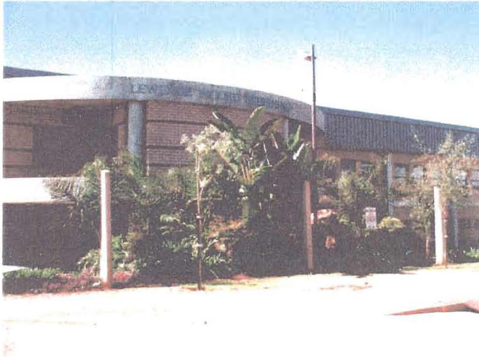
Lewende Woord Gemeente