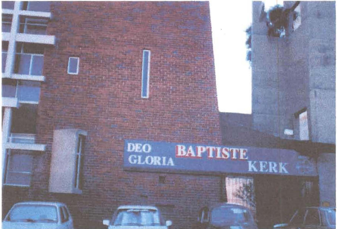
Deo Gloria Baptiste Kerk