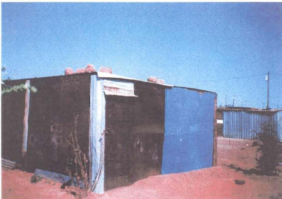
"Grace Baptist Church"