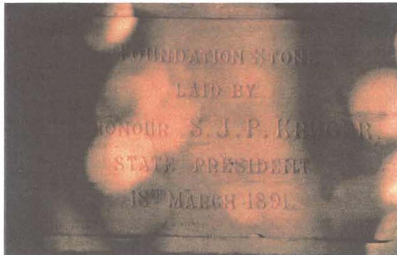
Hoeksteen van die eerste gebou van "Central Baptist Church" gelê deur President S J P Kruger