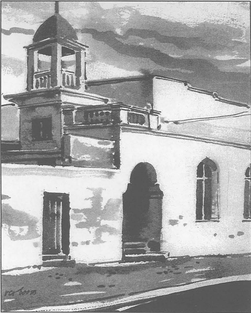
Figuur 34: Die Auwal-moskee in Dorpstraat – die eerste ingerigte aanbiddingsplek van die Kaapse Moslems.

Uit: F. Bradlow en M. Cairns, The early Cape Muslims (Kaapstad, 1978), frontespies.