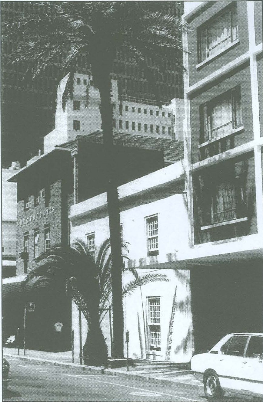
Figuur 35: Die Palmboom- of Dadelboom-moskee in Langstraat, ook bekend as die Jan van Boegies-moskee wat die tweede oudste Moslemaanbiddingsplek in Kaapstad is. In wese is dit 'n huis waarvan die boonste verdieping as gebederuimte of Langar ingerig is, terwyl die onderste gedeelte as woning van die imam gedien het.

Uit: F. Bradlow en M. Cairns, The early Cape Muslims (Kaapstad, 1978), p. 53.