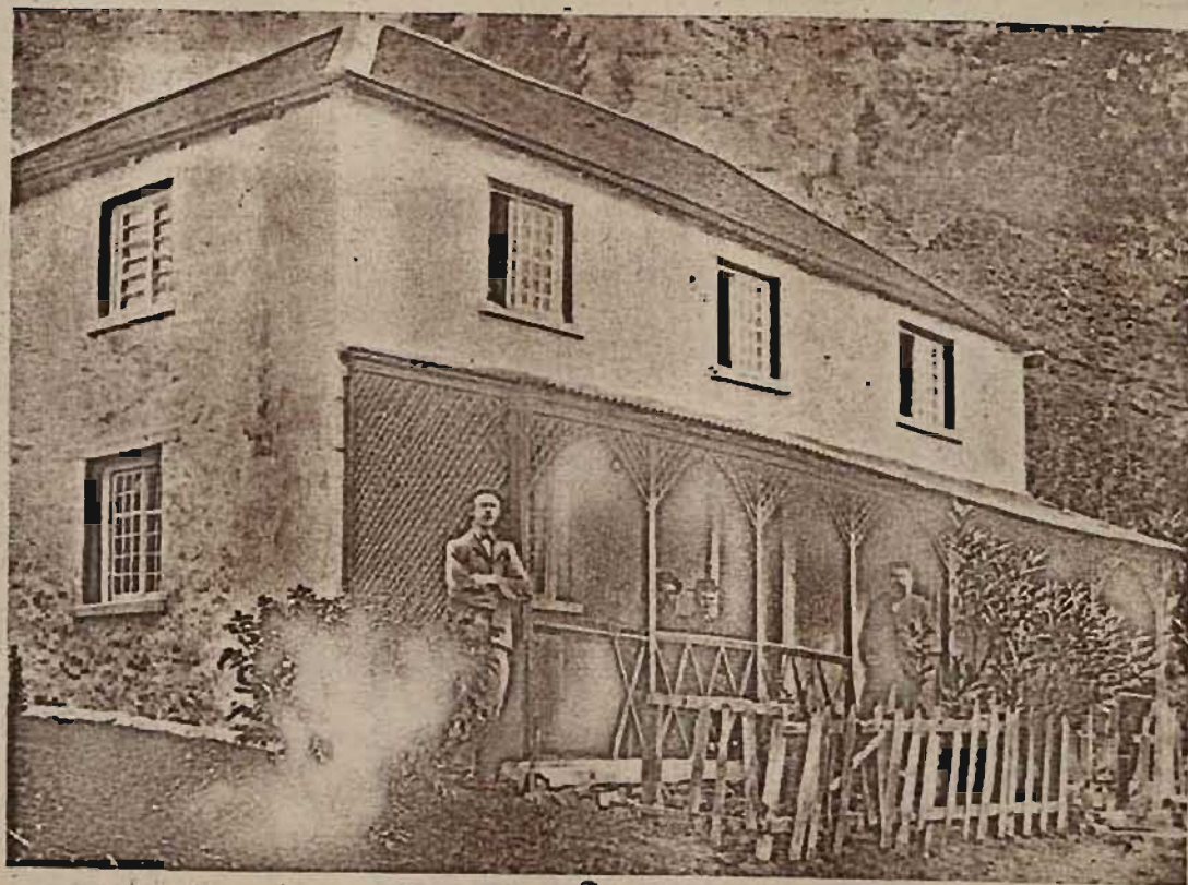
Genl. Cronje en gevolg in Kent Collage