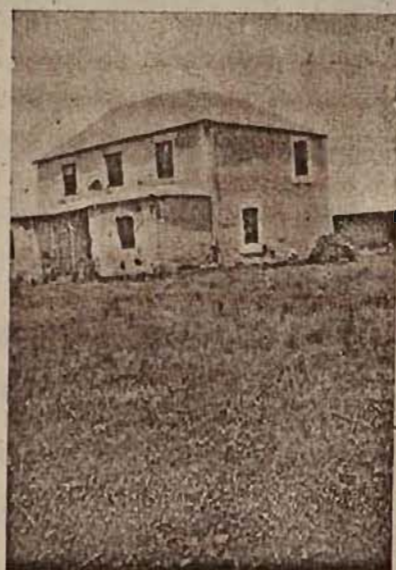
Cronje se Jonasmonument