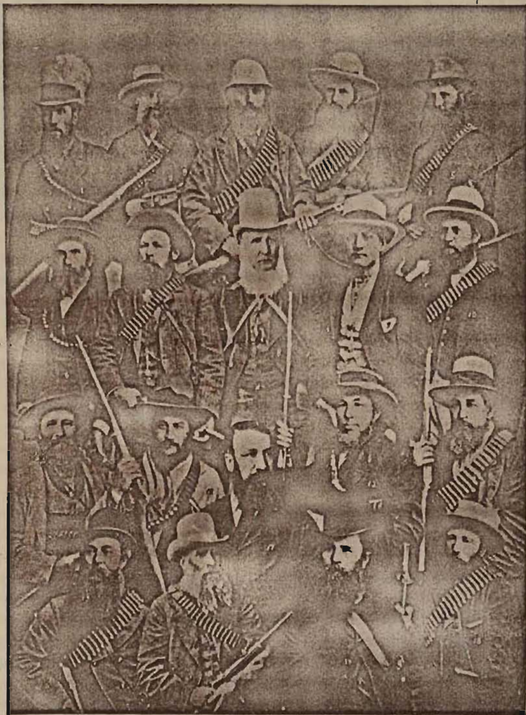
Leiers van die Eerste Vryheidsoorlog.