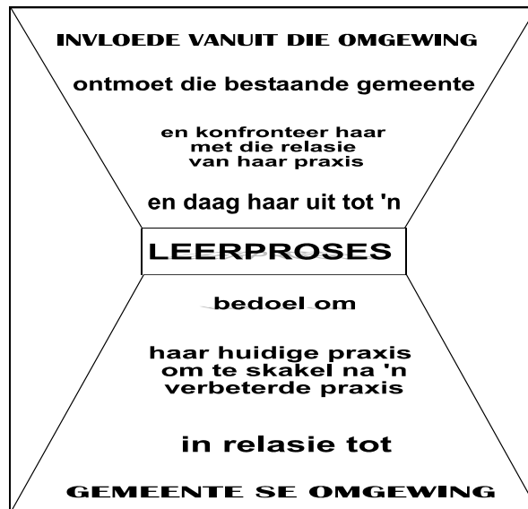
Figuur 1.3: Sisteemteorie

Pasveer (1992:236) illustreer dit aan die hand van die volgende diagram: