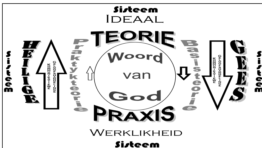
Figuur 1.4: Gemeentebou

Hierdie definisie word in figuur 1.4 skematies uitgebeeld: