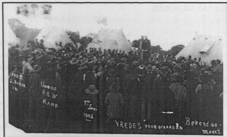
Figuur 55: Die aankondiging van die vredesvoorwaardes in Umbilo deur president Schalk Burger.