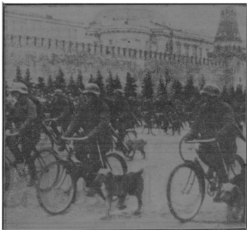
Russiese troepe van die verbindingsafdelings ry op hul fietse in die Rooi-plein van Moskou. Langs hulle draf hul honde wat hulle gebruik om boodskappe aan die front oor te dra.

sal sorg dra vir die bekendstelling hiervan, en vir die nodige reklame om 'n behoorlike afsetgebied te versker.