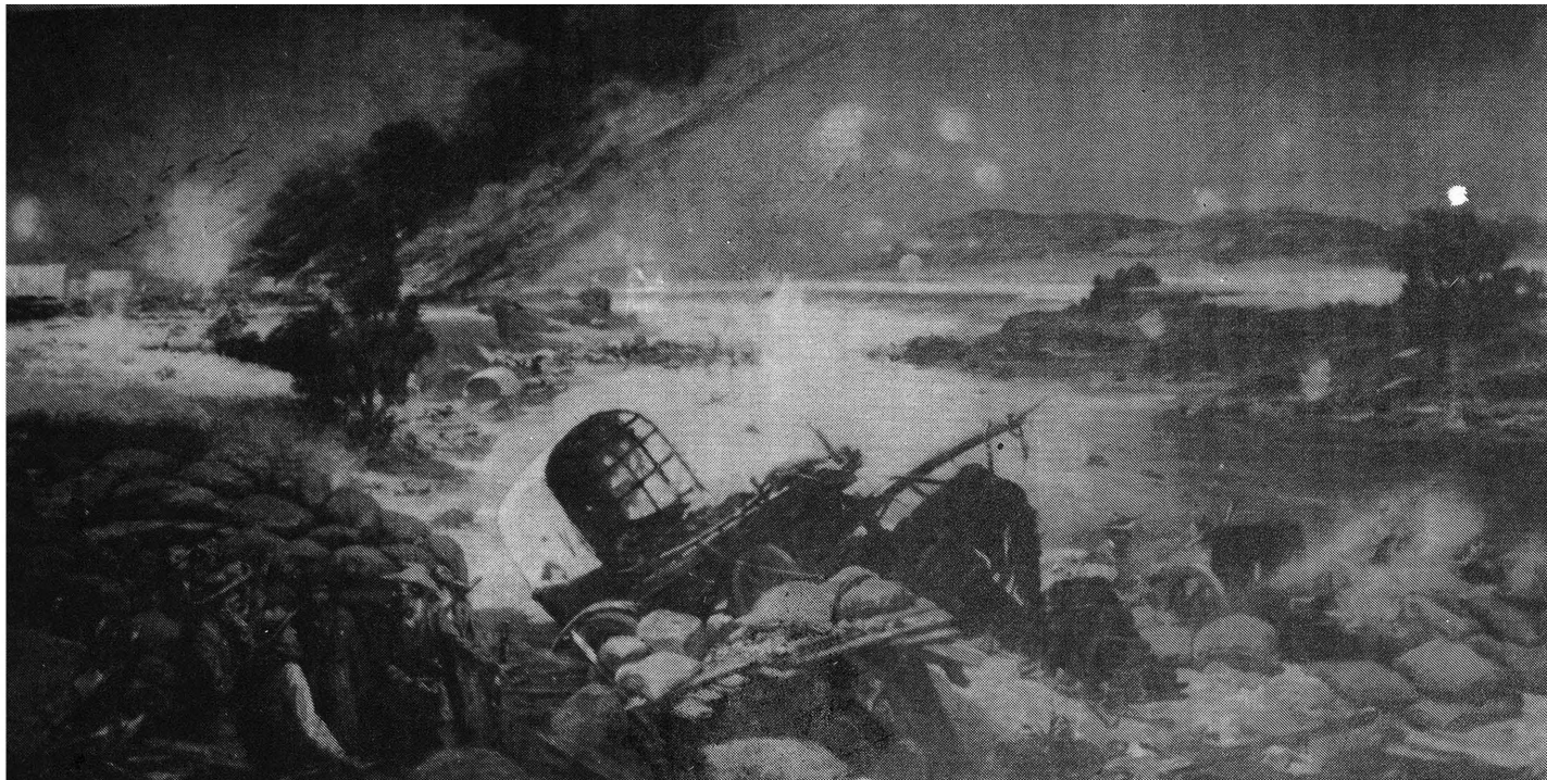
Skildery van die Duitse oorlogskilder Sylvester Reisacher van die beleg van generaal P.A. Cronjé se laer by Paardeberg, 17 tot 27 Februarie 1900, aanwesig in die Nasionale Kultuurhistoriese en Opelug-Museum (NASKO) te Pretoria.