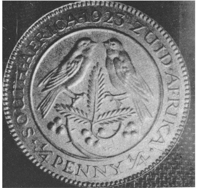
Agtersy van die farthing (kwart-penny) met twee mossies op 'n mimosatak