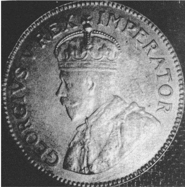
oorsy van die farthing (kwart-penny) van 1923 met afbeelding n koning George V as vors van die Britse ryk geslaan in die Munt Pretoria.