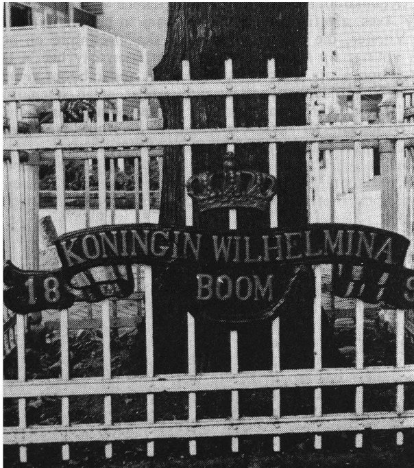
Die Koningin Wilhelminaboom in die dorp Rijnsburg by Leiden in Nederland. Dit is 'n Europese loofboom wat in 1898 geplant is. Foto: C. de Jong 1982