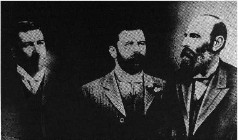
Genl. Beyers, Jopie Fourie, Genl de la Rey