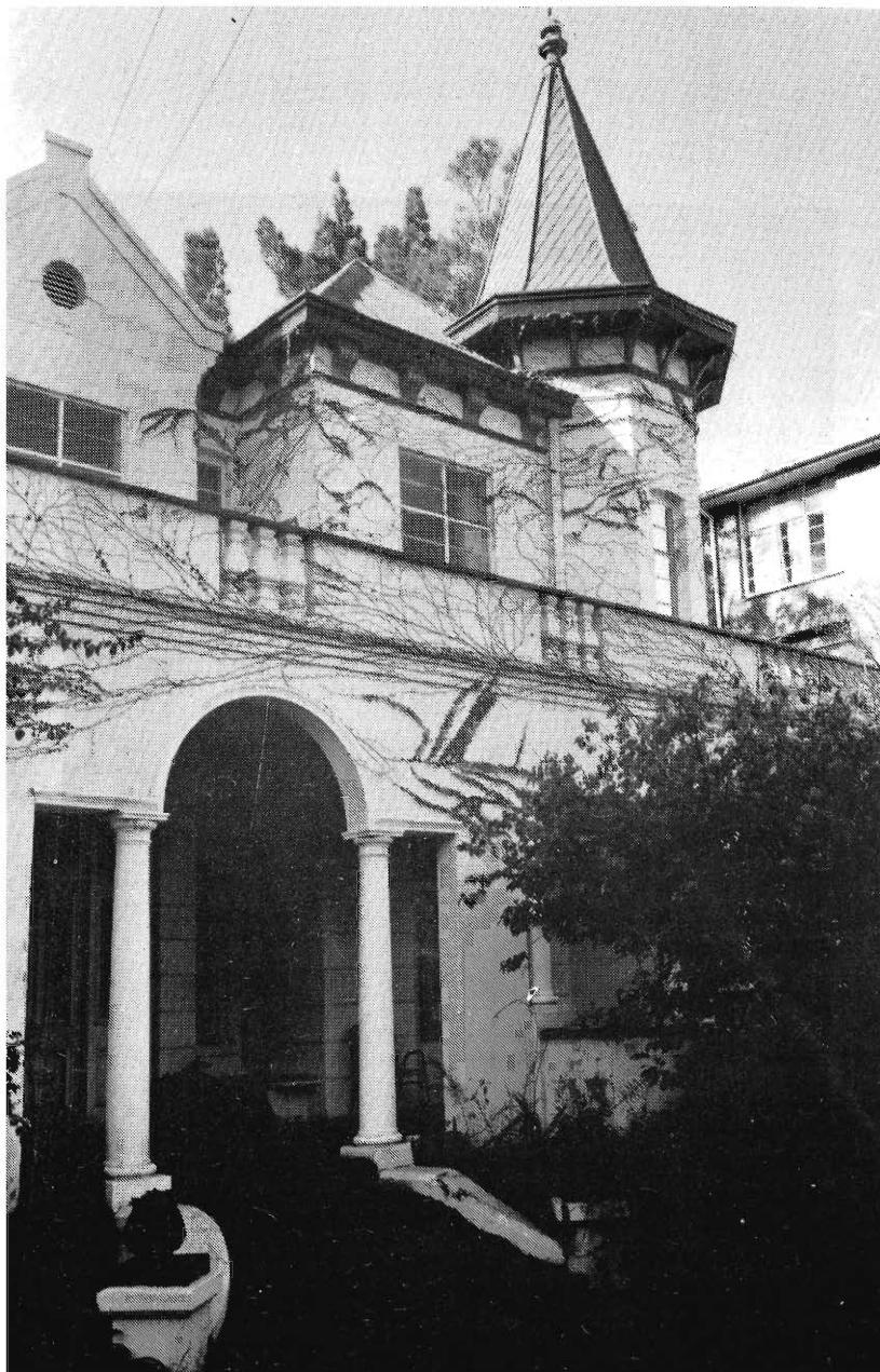
ZASM-HEREHUIS (Rissikstraat 62, Sunnyside). Gebou 1898. Gekoop deur die Vereniging Willem Punt op 9 November 1978. Transportakte No. B33796/1978