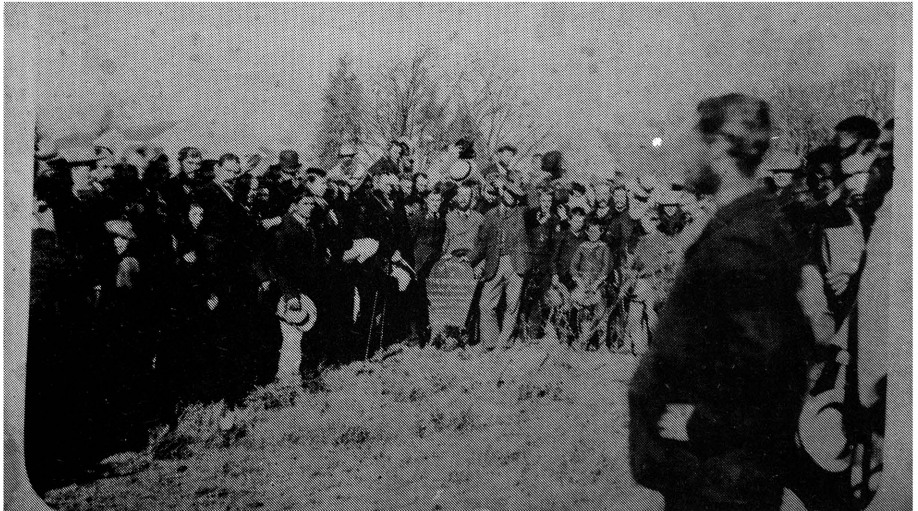
The British flag was handed back to the Boers by Lord Gladstone 1881. Photo taken at burial of the flag in the ground opposite Ulundi-house, which was then the Government House i.e. Amanda Mansions next to the English Church (Constantia Building) c/o Andries and Schoeman Streets.