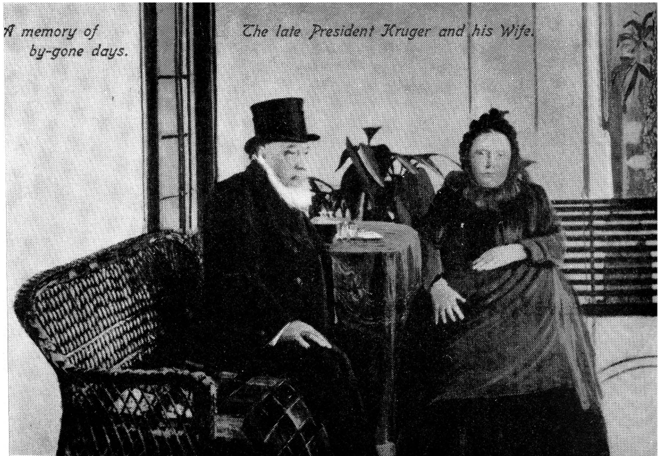
Foto van Pres. S.J.P. Kruger geneem by Waterval Onder – Augustus 1900